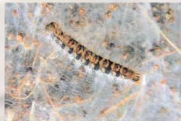
■ Oruga de Procesionaria

parte posterior, donde presenta un penacho de pelos de color marrón claro. Las alas anteriores son de color grisáceo, con intensidad variable, con tres franjas transversales más oscuras. Las alas posteriores son blanquecinas, con la parte más próxima al cuerpo muy pelosa.