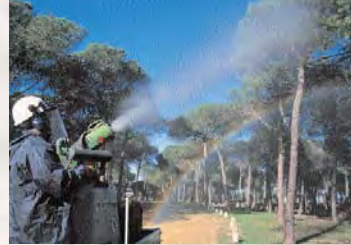
■ Tratamiento químico con cañón

La presencia de predadores y parásitos es muy importante, por lo que se colocan cajas anidaderas en lugares en los que la nidificación de las aves trogloditas es complicada por la ausencia de los huecos que