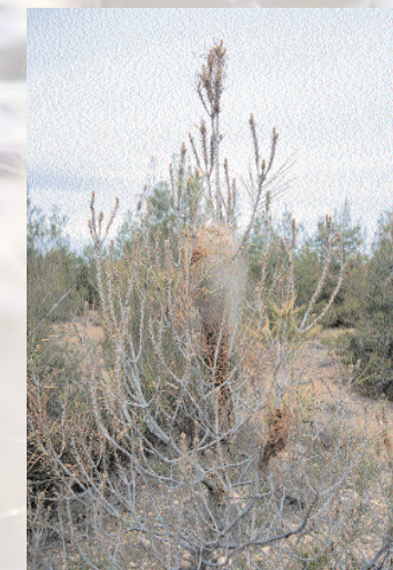
■ Pino joven defoliado por Procesionaria

El principal daño que causa la procesionaria a la masa es la defoliación de pies del género Pinus , producida durante la fase larvaria de este lepidóptero. Por otra parte la larva tiene unos pelos urticantes que producen reacciones alérgicas más o menos graves al hombre. Estas molestias impiden que se cumpla una de las principales funciones de los montes andaluces, el uso recreativo. Por otra parte, y de gran importancia son las perturbaciones que provoca su presencia en una serie de trabajos selvícolas como las podas o la recogida de piña, ocasionando graves pérdidas económicas. Directamente sobre los pies produce una pérdida de crecimiento que perdura hasta cuatro años después de la defoliación, pero en muy raras ocasiones causa la muerte de los pies. En repoblaciones jóvenes las defoliaciones totales sucesivas pueden provocar una subsistencia precaria de la masa impidiendo que se consiga la función protectora plena de la repoblación.