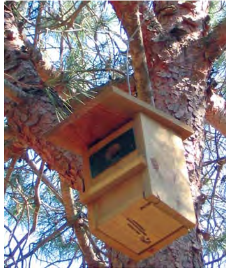
■ Caja anidadera

necesitan para la nidificación. Para llevar a cabo dicho Plan de Lucha Integrada, se mantiene una base de datos que relaciona el nivel de ataque anual con los datos de las masas andaluzas de pinar.