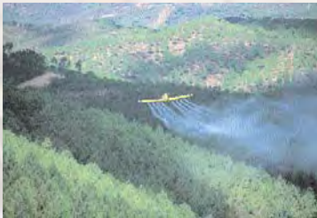
■ Tratamiento químico aéreo