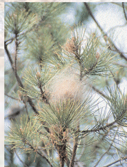
■ Bolsón de Procesionaria.