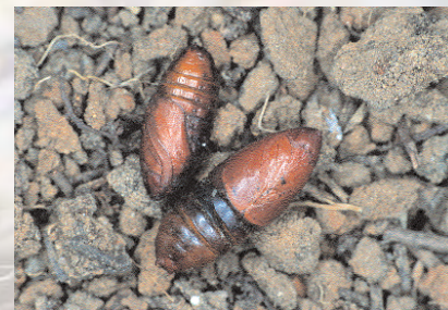
■ Crisálidas desprovistas del capullo de protección.

durar el doble e incluso puede precisar más de un año para completar su ciclo biológico entero.