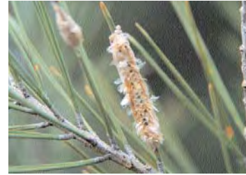
■ Puesta depredada