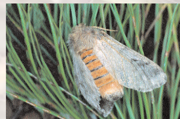
■ Hembra de Thaumetopoea

crecimiento comienzan a buscar un lugar para crisalidar, donde se transformarán en mariposas. Las orugas se trasladan de un pie a otro para alimentarse formando las procesiones. Aunque la procesión de enterramiento es la más contemplada, ya que las demás suelen tener lugar durante la noche.