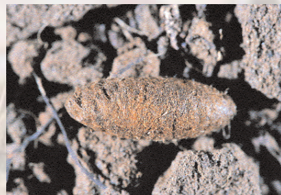
■ Capullo sedoso desenterrado.

Crisálida: cuando la oruga se entierra teje un capullo de seda que es extremadamente urticante. La crisálida se encuentra en el interior y tiene una forma ovoide de color castaño rojizo, de unos 20 mm de