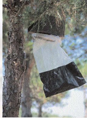
■ Colocación masiva de trampas de feromonas

datos sobre el nivel de ataque, dichos datos servirán para poner en práctica los métodos de control, que normalmente guardan una relación directa con el nivel de plaga alcanzado, según se muestra a continuación