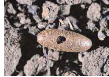
■ Crisálida parasitada