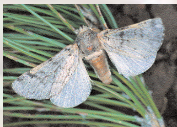
■ Macho de Thaumetopoea

parte posterior, donde presenta un penacho de pelos de color marrón claro. Las alas anteriores son de color grisáceo, con intensidad variable, con tres franjas transversales más oscuras. Las alas posteriores son blanquecinas, con la parte más próxima al cuerpo muy pelosa.