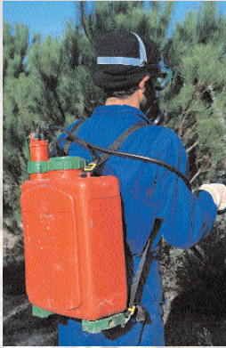
■ Tratamiento químico manual de los bolsones