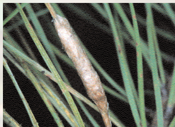
■ Puesta de Procesionaria

Adulto: la hembra es ligeramente mayor que el macho (36-49 mm de envergadura). Las antenas son pectinadas, aunque aparentemente son filiformes. El tórax se encuentra cubierto de pelos grisáceos, que en las zonas más cálidas se vuelven más pálidos. El abdomen es cilíndrico y grueso y está recubierto por unas escamas doradas que la hembra va colocando sobre la puesta para protegerla. Las alas anteriores tienen una coloración grisácea, con unas bandas transversales difusas más oscuras. Las alas posteriores son blanquecinas, con una mancha oscura en la zona anal. El macho es de menor tamaño (31-39 mm) y más estilizado que la hembra. Tiene las antenas claramente pectinadas y el tórax es densamente piloso, con coloración grisácea. El abdomen es más delgado que en la hembra y ligeramente apuntado en su