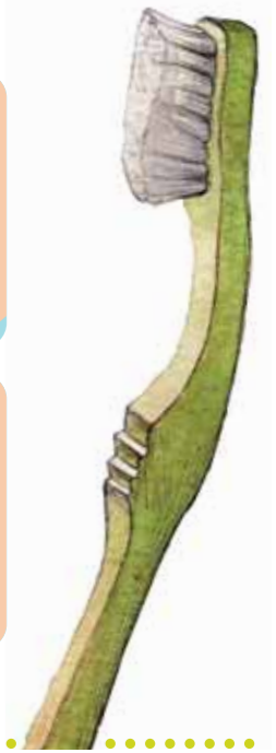
Figura 1 >> Primero se cepillan las superficies masticatorias de las muelas con movimientos de delante hacia atrás y vice-versa.

Figura 2 y 3 >> A continuación se coloca el cepillo entre la encía y el diente y presionando suavemente se hacen pequeños movimientos de barrido, varias veces, primero por las superficies externas y luego por las internas. Sin prisas y sin olvidar ningún diente.