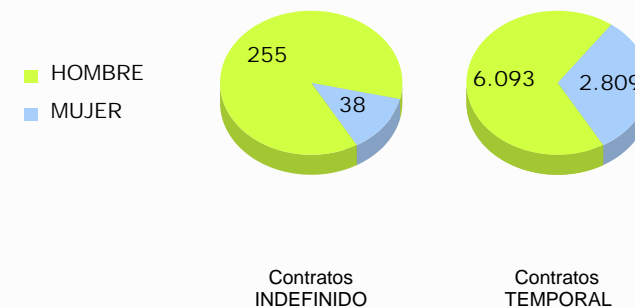
Distribución de la contratación por sexo y duración del contrato