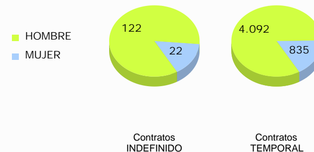
Distribución de la contratación por sexo y duración del contrato