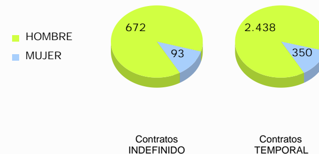
Distribución de la contratación por sexo y duración del contrato