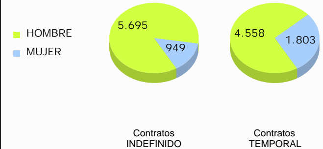
Distribución de la contratación por sexo y duración del contrato