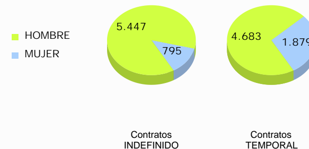
Distribución de la contratación por sexo y duración del contrato