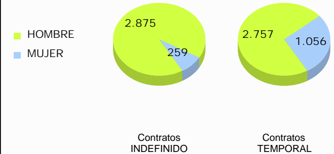
Distribución de la contratación por sexo y duración del contrato