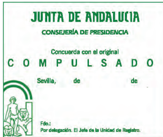
Sello de compulsión.

El sello de compulsión tiene forma rectangular.