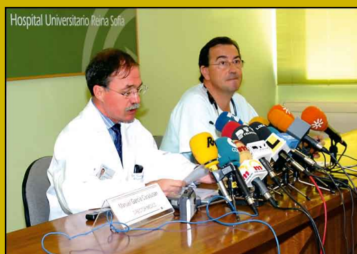
El director médico y el coordinador de trasplantes, en una rueda de prensa.

LA TRANSMISIÓN DE MENSAJES POSITIVOS, QUE INFUNDAN CONFIANZA Y MUESTREN EL PROGRAMA DE TRASPLANTES COMO UN SISTEMA EQUITATIVO Y EFICAZ, MEJORA LA PERCEPCIÓN QUE LOS CIUDADANOS TIENEN DE ESTA PRÁCTICA Y LA PREDISPOSICIÓN A DONAR.