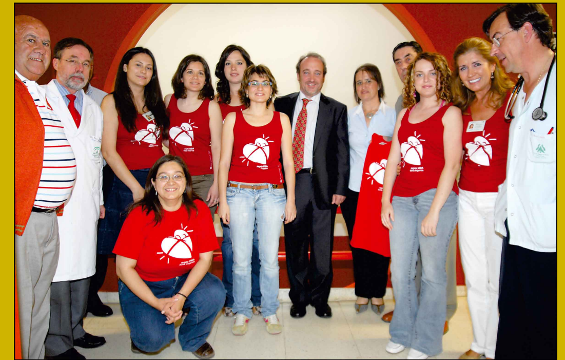
Médicos, directivos, trasplantados y periodistas, en la presentación de la VI Semana del Donante.

La transmisión de mensajes positivos, que infundan confianza y muestren el programa de trasplantes como un sistema equitativo y eficaz, mejora la percepción que los ciudadanos tienen de los trasplantes y la predisposición a la donación, un gesto altruista sin parangón. Los textos sobre el programa de trasplantes que se preparan desde el hospital intentan crear una atmósfera positiva con la difusión de noticias que promuevan en el lector una actitud receptiva hacia la donación. Se lanzan mensajes muy claros y concisos sobre las posibilidades de una terapéutica que salva vidas. Se debe transmitir credibilidad, aclarar el complejo proceso de la donación y el trasplante de órganos y agradecer a la sociedad su generosidad.