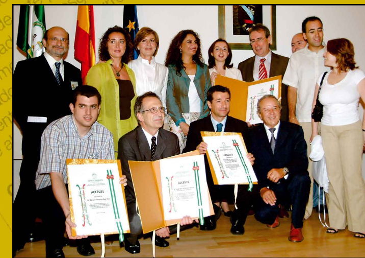
Entrega de los premios periodísticos 'Luis Portero' 2004 en el hospital.