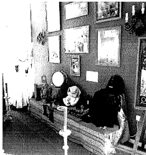
Rincón dedicado a la Merced en el Hotel Mirador de Córdoba.

Sin embargo, el Palacete Mirador de Córdoba no será el único establecimiento que colaborará en la difusión de la Semana Santa. En la misma línea se encuentran la Casa Palacio Restaurante El Bandolero, que tendrá un rincón dedicado a la Hermandad de la Misericordia; el Hotel Hospes, a los Dolores; el Restaurante el