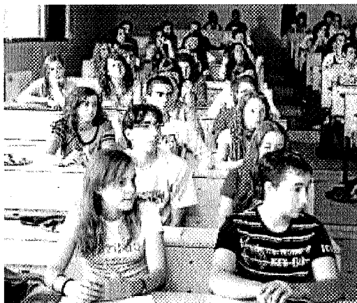
Estudiantes de primero de Medicina, durante la presentación de la carrera.

hoy no se han dado cuenta de lo que hay", sentenció.