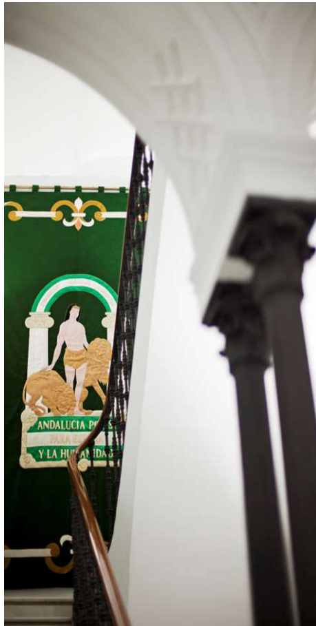
Junta de Andalucía