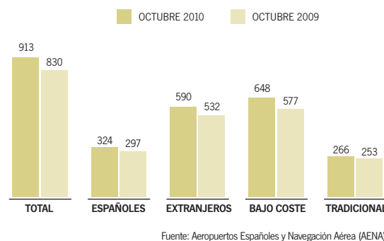
[ GRÁFICO ] Llegadas de pasajeros a aeropuertos andaluces por procedencia y tipo de compañía. Octubre 2010/2009. Miles de pasajeros.