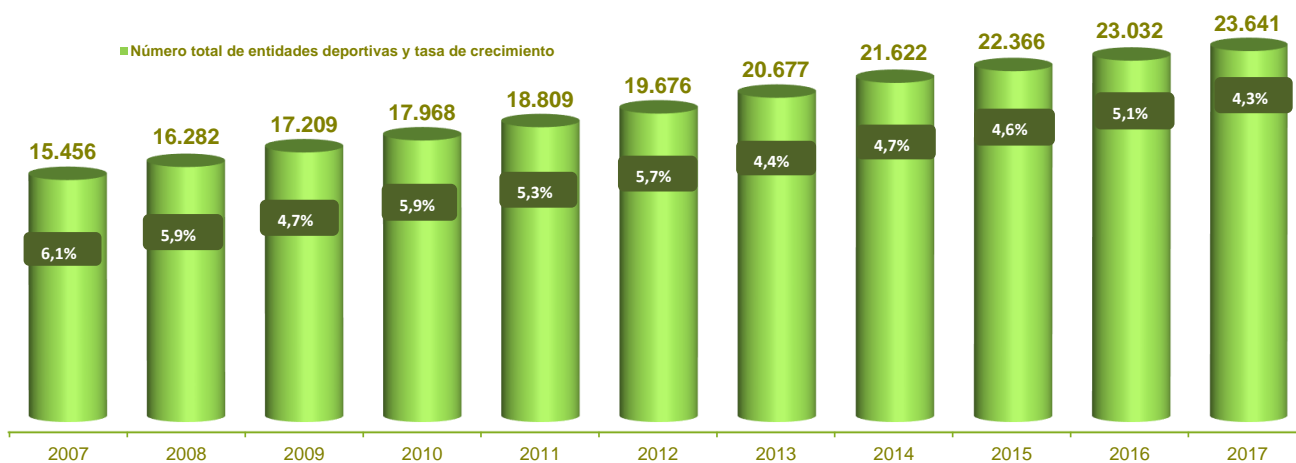
Gráfico 3. Evolución anual del número total de entidades deportivas registradas

*Esta cifra del acumulado de entidades "Club deportivo" 2016, varía conforme a los datos ofrecidos en la Estadística del Registro Andaluz de Entidades Deportivas 2016, por la siguiente razón; la Asociación inscrita con el número 6150, cancelada con fecha 28/05/2014, es nuevamente inscrita a consecuencia de la Resolución estimatoria de fecha 15/05/17, del Recurso de Alzada interpuesto por la entidad.