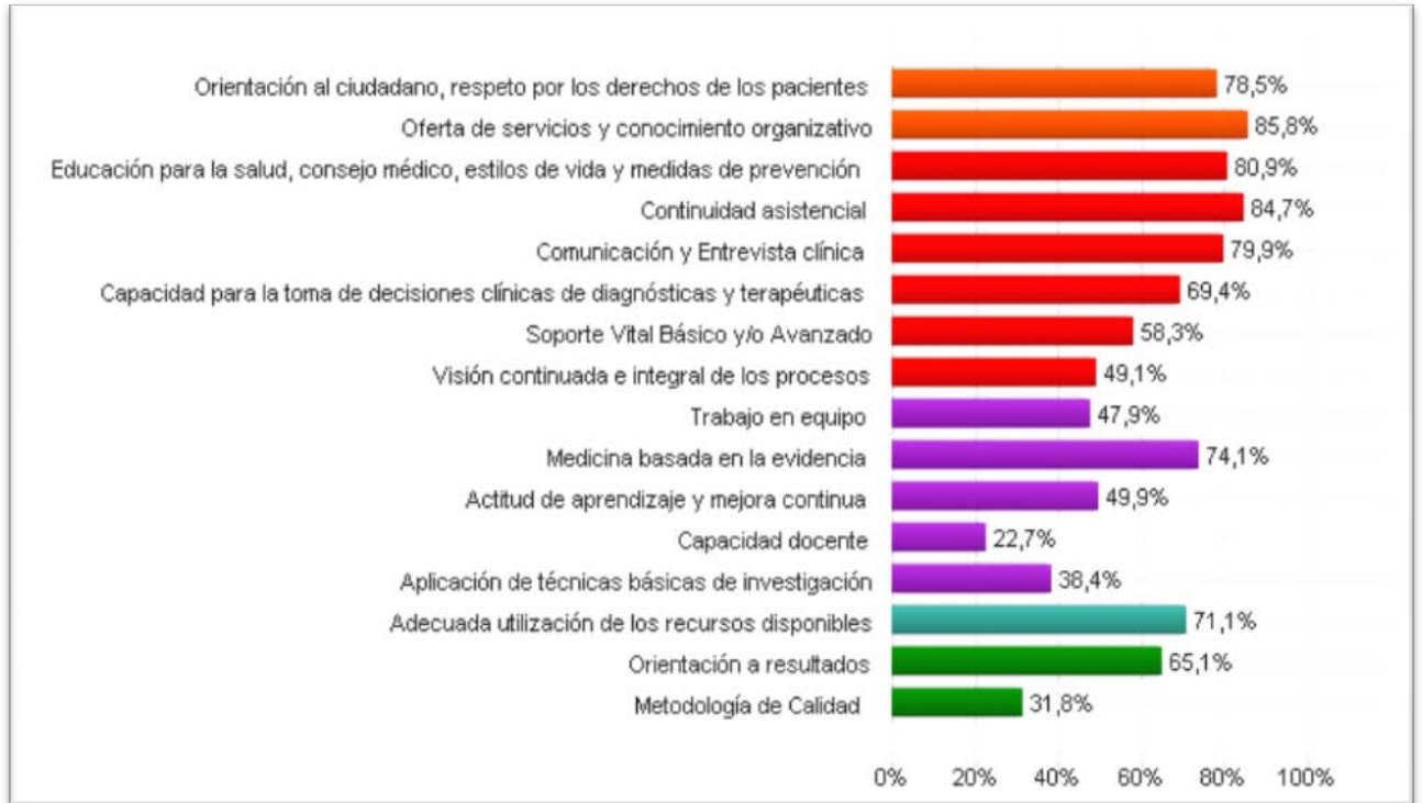
Figura 3: Porcentaje cumplimiento de competencias

Posteriormente, se han analizado las 79 evidencias comunes a estos 8 manuales (las evidencias “alternativas” se han considerado como evidencias independientes), identificando el número y porcentaje de cirujanos/as que han aportado cada una de estas evidencias durante sus procesos de acreditación. De este análisis se extraen las siguientes conclusiones.