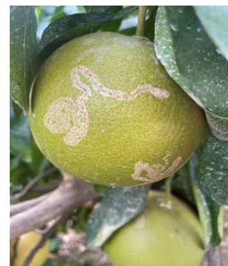
Daño de minador en fruto

esta semana la incidencia del minador de los cítricos sobre los nuevos brotes ( % de brotes afectados ), aumenta sensiblemente respecto a la semana anterior hasta alcanzar un valor medio provincial de 0,92 % (0,36 % la semana pasada) . Datos obtenidos sobre las observaciones realizadas en 30 ECB . Si analizamos por zonas biológicas , los datos obtenidos son los siguientes: La Vega con un 0,85 % es la única zona que no supera la media provincial, aunque su valor se duplica respecto a la semana anterior, por el contrario Las Colonias con un 1,50 % y La Sierra con un 1,33 % de brotes afectados , son las zonas biológicas que superan el valor medio provincial.