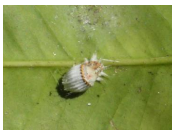
Hembra cochinilla acanalada con ovisaco

Plaga originaria de Australia y que actualmente está extendida por todo el mundo. Especie muy común en cítricos y numerosas plantas ornamentales.