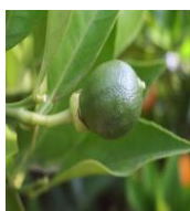
"12" Cierre de cáliz

El estado fenológico dominante es 12 "cierre de cáliz" en el 83,33 % de las ECB. En las parcelas más atrasadas el estado dominante es 11 "cuajado de fruto" , presente en el 6,7 % de las ECB. En el caso de las parcelas más adelantadas el estado dominante del fruto es J "fruto al 40 % de desarrollo" en el 10 % de las ECB muestreadas.