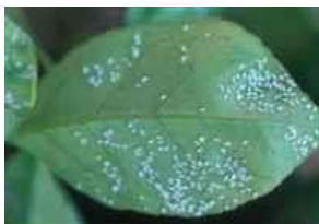
Colonia de mosca blanca

Esta semana continua sin observarse la presencia de Parabemisia en brotes en las 6 ECB muestreadas.