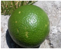
Daños por Mosquito verde en fruto

Esta semana las observaciones realizadas sobre frutos en 31 ECB , no se observa la presencia de frutos atacados por este agente.