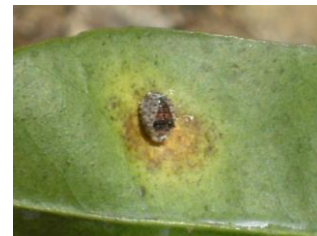
Pupa de Rodiola cardinalis sobre envés de la hoja

Las larvas al salir del ovisaco se sitúan en las hojas tiernas, en el envés y a lo largo de los nervios, manteniéndose ahí los dos primeros estadios. En el tercer estadio se traslada al peciolo de la hoja o a las ramas jóvenes. Las hembras adultas viajan considerables distancias desde el exterior de la planta hasta el interior donde se fija a la corteza de los brotes, ramas leñosas e incluso al tronco. Posteriormente comienzan a producir el ovisaco.