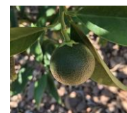
"J" fruto 40 % desarrollo

Durante la semana analizada, las condiciones meteorológicas en las zonas citricolas estuvieron marcadas por la ausencia de precipitaciones y por temperaturas elevadas, acordes con la época estival. La temperatura máxima media alcanzó los 35 °C , mientras que la temperatura media se situó en 26 °C y la mínima en 16 °C .