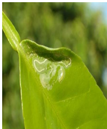
Mina de larva de minador en hoja

esta semana la incidencia del minador de los cítricos sobre los nuevos brotes ( % de brotes afectados ), aumenta sensiblemente respecto a la semana anterior hasta alcanzar un valor medio provincial de 0,92 % (0,36 % la semana pasada) . Datos obtenidos sobre las observaciones realizadas en 30 ECB . Si analizamos por zonas biológicas , los datos obtenidos son los siguientes: La Vega con un 0,85 % es la única zona que no supera la media provincial, aunque su valor se duplica respecto a la semana anterior, por el contrario Las Colonias con un 1,50 % y La Sierra con un 1,33 % de brotes afectados , son las zonas biológicas que superan el valor medio provincial.