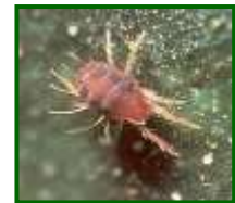
Adulto de Ácaro rojo

Araña roja: Es un ácaro fitófago con un potencial reproductivo muy alto (es muy prolífico), su ciclo de vida es corto, su tasa de desarrollo es rápido y tiene capacidad para dispersarse rápidamente. El tamaño de la hembra adulta oscila entre los 0,4 y 0,6 mm., con un aspecto globoso. El macho es aplanado y más pequeño que la hembra. Estos ácaros presentan diferentes características morfológicas, su color puede variar en función del estado de desarrollo, factores ambientales, régimen alimenticio y planta huésped.