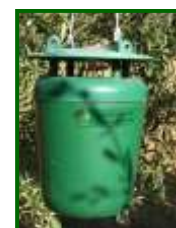
Trampa Funnel para capturar adultos

A finales de mayo se efectuó el muestreo puntual para determinar el daño producido por las larvas de esta plaga , contabilizándose su presencia en el 18,5 % de las parcelas muestreadas (sobre 27 estaciones de control), con una media provincial de solo 0,06 excrementos frescos por árbol (0,03 en 2025 y 2024, 0,3 en 2023 y 0,2 en 2021 y 2022). La zona biológica de Setenil fue la más afectada, con 0,27 excrementos frescos por árbol.