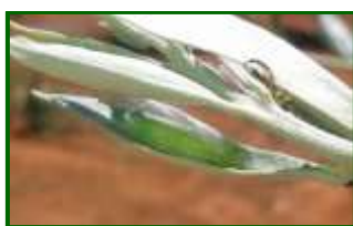
Larva de Glifodes

Se ha observado presencia de larvas de esta plaga en el 58 % de las parcelas muestreadas esta semana (sobre 33 estaciones de control), registrándose una media provincial del 4,3 % de brotes de la copa afectados (4,5 % la anterior semana). La zona biológica más afectada ha sido Jerez con un 10,9 %.