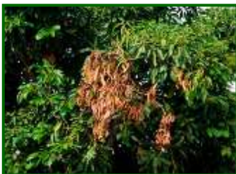
Síntomas en ramas

Los síntomas de esta enfermedad se han detectado esta semana en el 43 % de las parcelas analizadas, localizándose de forma exclusiva en el Campo de Gibraltar, donde la afectación se sitúa en el 3,6 % de los árboles. A nivel provincial, la media apenas varía y se mantiene estable en un 2,2 %, una cifra muy similar al 2,3 % registrado en el muestreo anterior.