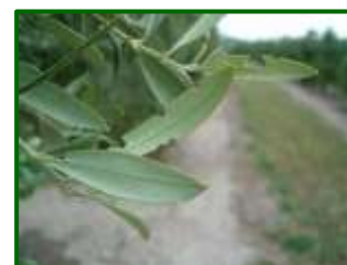
Daño por adulto de otiorrinco

Antes de llegar al estado adulto, pasa por varias fases. La puesta de huevos ocurre a finales de verano o principios de otoño en suelos húmedos, por lo que depende mucho de las lluvias. Los huevos, depositados bajo tierra cerca del olivo, cambian de blanco a negro antes de eclosionar tras unas dos semanas. Al nacer, las larvas se entierran y se alimentan de las raíces, mientras que la fase de pupa se desarrolla en el suelo durante gran parte del invierno. Al llegar mayo y junio, comienzan a salir los primeros adultos de otiorrinco. Salen durante la noche, se alimentan de las hojas del olivo y, por la mañana, vuelven a refugiarse del sol. Cuando las temperaturas comienzan a subir, sus refugios son incluso más profundos. El ciclo vuelve a comenzar a finales de verano, cuando las hembras ponen los huevos.