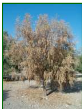
Olivo con Verticilosis

Realizadas ya todas las prospecciones para comprobar el estado de incidencia de esta enfermedad en el cultivo, esta campaña se ha observado su presencia en el 27 % de las parcelas muestreadas (sobre 33 estaciones de control), con una media provincial del 0,52 % de árboles con síntomas (0,1 % en 2025, 0 % en 2024 y 0,04 % en 2023). La zona biológica más afectada por este hongo ha sido Jerez con un 1,9 % de árboles con síntomas, seguida de Villamartin con un 1 %.