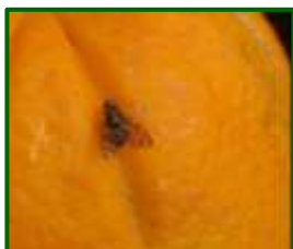
Adulto de mosca de la fruta

Esta semana se han registrado capturas de adultos en el 56 % de las parcelas con trampas (9), con una media provincial muy baja, de solo 0,47 moscas/trampa y día (0,42 la semana pasada). No se observan frutos picados.