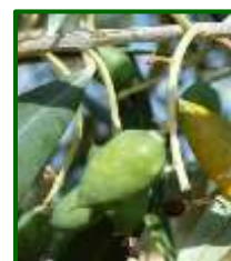
Estado fenológico "G2" (Fruto cuajado)

Para los próximos días las temperaturas máximas van a estar en torno a los 28-33 °C en campiña y entre 29 y 33 °C en la sierra. Las temperaturas mínimas serán de 16-28°C, en campiña, y 16-21 °C en la sierra. El viento dominante va a ser flojo-moderado de componente variable tanto en la campiña como en la sierra. No se esperan lluvias.