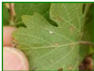
Larva de Melazo

En referencia a este agente, esta semana no se han observado cepas con presencia de esta cochinilla en ninguna de las parcelas muestreadas.