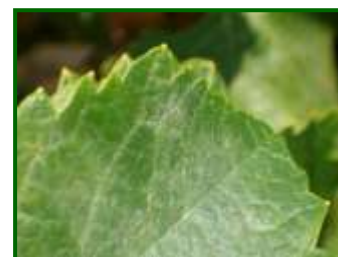
Oídio en hoja

La temperatura, la humedad y, en menor medida la insolación, son los factores climáticos que condicionan el desarrollo del hongo. Alrededor de 15°C la temperatura comienza a ser favorable estando su óptimo en los 25-28°C. El desarrollo de la enfermedad se ve favorecido por humedades altas, pero las lluvias abundantes frenan su desarrollo.