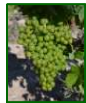
Estado fenológico "L" (Cerramiento del racimo)

Para la próxima semana las temperaturas máximas van a estar alrededor de los 28-33 °C, y las mínimas en torno a los 16-18 °C. El viento dominante va a ser flojo-moderado de componente variable, no esperándose lluvias para la semana que viene.