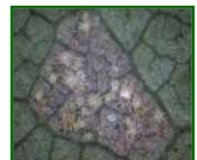
Diferentes estadios de desarrollo del ácaro