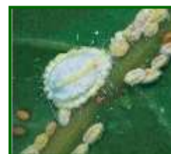
Hembra adulta y ninfas

Esta es una cochinilla que puede afectar a una gran variedad de vegetales de todo tipo. Se detectó por primera vez en la península ibérica en 2015 en plantaciones de mango. Se trata de una especie partenogenética; esto es, hay momentos en que las hembras solas pueden producir una nueva generación (haploide) que puede ser muy numerosa con el objeto de colonizar rápidamente y con gran número de individuos. Las hembras tienen un ovisaco, como en el caso de la cochinilla acanalada de los cítricos, pero de tamaño más pequeño.