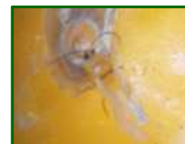
Piojo rojo de California

El piojo rojo de California es un hemíptero diaspidido considerado como una de las principales plagas de cítricos. El daño de esta plaga está provocado, principalmente, por la presencia de hembras adultas. La forma de éstas es de escudos céreos de color rojizo en ramas, hojas y frutos. En ramas y hojas puede llegar a provocar un debilitamiento de la planta. Los daños directos más graves es su presencia sobre los frutos, ya que muestran preferencia por esta parte del árbol, con la consiguiente depreciación comercial, aunque éstos no alteren las cualidades organolépticas de la fruta. Al alimentarse del tejido vegetal produce manchas cloróticas; las hojas muy atacadas amarillean y caen. Puede llegar a producir un debilitamiento general del árbol, en caso de una fuerte presencia.