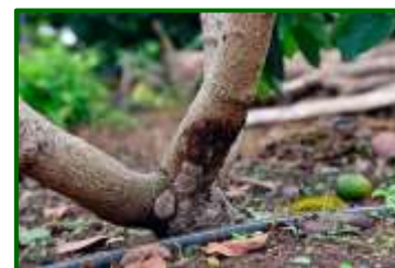
Podredumbre de cuello y raíz

A veces hay una pequeña progresión desde las raíces alimenticias a las raíces más gruesas. Ocasionalmente este patógeno puede causar chancros en la base de los troncos de árboles de aguacate. La infección por el patógeno es óptima a una temperatura de suelo entre 21 y 30 °C y no hay prácticamente infección por encima de 33 °C o por debajo de 9-12 °C. El pH óptimo para el desarrollo de la enfermedad es de 6,5.