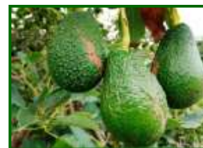
Síntomas de roña

Cuanto más joven sea el fruto o la hoja y más alta la humedad relativa es mayor el riesgo de infección. Las heridas causadas por los trips favorecen la implantación de este hongo por lo que hay que vigilar la presencia de estos insectos.