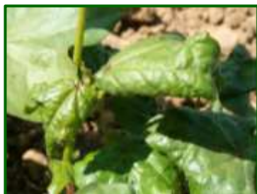
Plántula atacada por pulgones

Respecto al pulgón , esta semana se han observado éstos en el 42 % de las parcelas muestreadas, con un nivel medio provincial de presencia de 0,4 (nivel de 0 a 3) (0,5 la semana pasada). La zona biológica más afectada ha sido Campiña de Jerez con un nivel de 0,53.