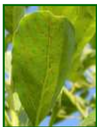
Ácaro cristalino, síntomas

Esta semana se ha detectado presencia de este ácaro en el 6 % de las parcelas muestreadas, registrándose una media provincial de solo el 0,1 % de hojas con formas móviles (0,2 % la semana pasada). La Janda ha sido la zona biológica más afectada.