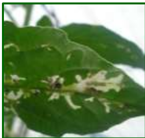
Tuta en hoja de tomate

En cuanto a plagas, se ha detectado presencia importante de polilla del tomate ( Tuta absoluta ) en el 100 % de las parcelas muestreadas, y en el 14,6 % de las plantas (14 % en el anterior muestreo). Se han detectado daños en frutos en el 20 % de las parcelas muestreadas y en el 1,4 % de los frutos (1,6 % en el muestreo anterior).