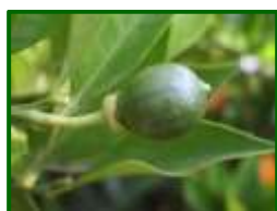
Estado fenológico "1z" (Cierre del cáliz)

El estado fenológico dominante en la mayoría de las parcelas de la provincia es "1z" ( Cierre del cáliz ). Esta semana se están recolectando las variedades Valencia Delta, Valencia Late y Valencia Midnight.