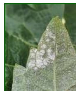
Mildiu en hoja

Este hongo sobrevive principalmente como oosporas invernantes en restos de cosecha (hojas y sarmientos), aunque también puede sobrevivir como micelio en las yemas y en hojas persistentes. Una vez que los brotes de la vid alcancen los 10 cm de longitud, se produzcan temperaturas medias superiores a 10°C y tengamos una precipitación de al menos 10 mm en uno o dos días, comienza la germinación de las oosporas invernantes; es lo que se denomina contaminaciones primarias.