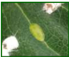
Hembra joven y otras con ovisaco

Es una especie partenogenética que suele tener entre tres o cuatro generaciones anuales. Las hembras son de color verde y tienen un ovisaco, donde ponen sus huevos. No suele causar daños importantes si no aparece en grandes cantidades. Produce melaza, que puede ser sustrato de negrilla y atraer a las hormigas.