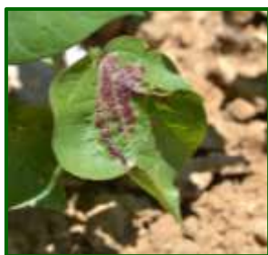
Hoja con Araña roja

hoja es de 0,08 (0,06 la anterior semana). Las previstas altas temperaturas van a ser favorables para su desarrollo y expansión en el cultivo, por lo que habrá que estar atentos a su evolución.