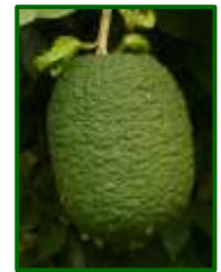
Estado fenológico J (Fruto desarrollándose)

Para la próxima semana las temperaturas van a estar entre 26 y 32 °C de máxima y 17-22 °C de mínima. El viento dominante va a ser flojo de componente este, no esperándose lluvias.