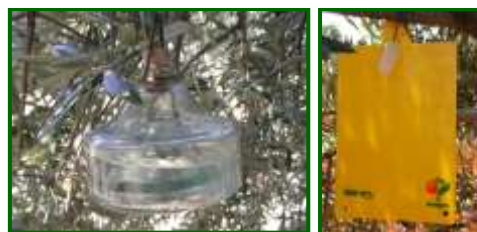
Trampas para capturar Mosca del olivo

Instaladas la mayoría de las trampas para el monitoreo de esta plaga, esta semana se han registrado capturas de adultos en mosqueros en el 96 % de las parcelas con este tipo de trampa (27 estaciones de control), registrándose una media provincial de 1,8 moscas/mosquero y día (2,2 en el anterior muestreo); siendo Algodonales la zona biológica con mayores valores de capturas en mosqueros, con 3,5 moscas/trampa y día.