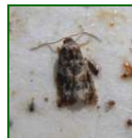
Adulto de Polilla

Las larvas de la 1ª generación destruyen botones florales, flores e incluso frutos recién cuajados que se reúnen en (glomérulos) o nidos en donde viven. Las larvas de las siguientes generaciones producen pérdida de cosecha y calidad, sobre todo en las variedades de uvas de mesa, debido a que se alimentan de las bayas y penetran en ellas.