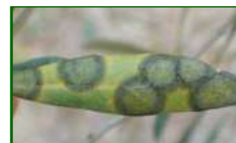
Hoja con síntomas de Repilo

El control integrado del repilo se basa en una combinación de medidas preventivas, culturales y fitosanitarias orientadas a reducir la humedad en el árbol y limitar el desarrollo del hongo. Se recomienda realizar podas que favorezcan la aireación y la entrada de luz en el interior de la copa, especialmente en olivares intensivos, zonas húmedas, vaguadas o áreas próximas a cauces y arroyos, donde existe mayor riesgo de condensación y humedad persistente. También se aconseja evitar el exceso de fertilización nitrogenada, ya que favorece una vegetación más sensible a la enfermedad, y tener en cuenta la susceptibilidad varietal, evitando en lo posible variedades especialmente sensibles como Arbequina o Manzanilla. Además, es importante gestionar adecuadamente los restos vegetales y hojas caídas, ya que pueden actuar como reservorio de inóculo del hongo.