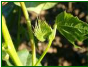
Primeros botones florales

El fenología dominante en la provincia es "1B" ( Primeros botones florales ). Costa Noroeste es la zona biológica más adelantada, con el mayor número de botones florales, en torno a 1 botón por metro cuadrado.