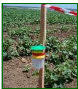
Trampa para capturar adultos

En cuanto a capturas de adultos de este agente, esta semana se han registrado éstas en el 15 % de las pocas parcelas con trampas (33), contabilizándose una media provincial de 3,8 adultos/trampa y día. La única zona biológica con capturas de este microlepidóptero ha sido Costa Noroeste con 7,9 adultos/trampa y día.