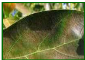
Hoja con araña parda

Esta semana no se ha detectado presencia de este ácaro en ninguna de las parcelas muestreadas.