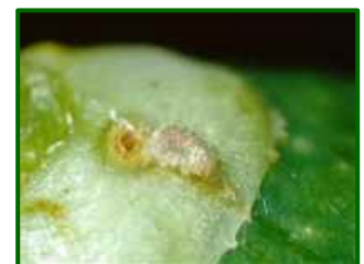
Orificio de entrada en fruto

El porcentaje de parcelas de control con frutos afectados es el 100% de las 90 parcelas analizadas.