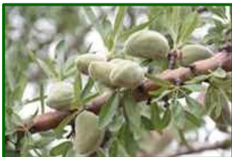
Estado fenológico "J"

El estado fenológico dominante en las parcelas de control es fruto desarrollado ("J").