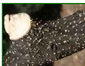
Orificios de entrada

Siguen produciéndose salidas de adultos en los palos cebo.