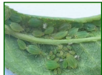
Colonia de pulgones

Al principio del ciclo de cultivo los individuos que se encuentran son hembras que se reproducen de manera axenuada produciendo hembras exclusivamente, que nacerán de forma vivípara. En esa fase, si las condiciones ambientales les son propicias, pueden aumentar su población de manera importante en poco tiempo.