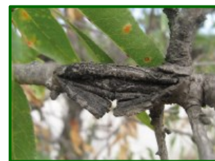
Daño en madera

Las variedades Antoñeta y Guara también son especialmente sensibles a esta enfermedad.