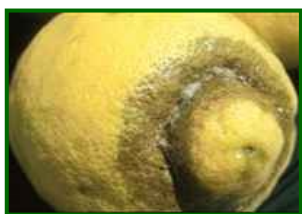
T. urticae Síntomas en fruto

En las parcelas de control la incidencia sube hasta el 2'5% de hojas con formas móviles, no se observa en frutos.