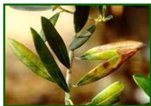
Hojas con síntomas

En las mismas fechas que se evaluó el repilo normal también se evaluó la incidencia de éste. La media provincial era el 0'5% de hojas afectadas, el año pasado en esas fechas se obtuvo el 1'0%; se encontraron síntomas en el 40% de las 52 parcelas de control muestreadas.