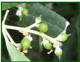
Estado fenológico "G2"

Según la previsión meteorológica de la próxima semana, la temperatura experimentará un notable ascenso y la posibilidad que ocurra alguna precipitación es nula.