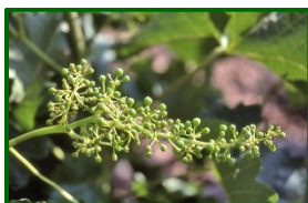
Estado fenológico "K"

Según la previsión meteorológica de la próxima semana, la temperatura subirá significativamente y la posibilidad de que ocurran precipitaciones es nula.