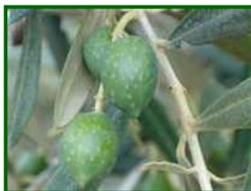
Estado fenológico "H"

Según la previsión meteorológica de la próxima semana, la temperatura será similar a la de ésta y la posibilidad de que ocurra alguna precipitación es nula.