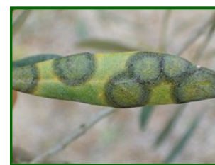
Hoja con síntomas

Temperaturas entre 8°C y 24 °C favorecen el desarrollo del hongo, siendo la temperatura óptima de 20°C. La humedad relativa óptima es el 100%.