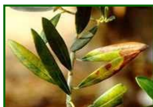
Hojas con síntomas

En las mismas fechas que se evaluó el repilo normal también se evaluó la incidencia de éste. La media provincial era el 0,5% de hojas afectadas, el año pasado en esas fechas se obtuvo el 1,0%; se encontraron síntomas en el 40% de las 52 parcelas de control muestreadas.