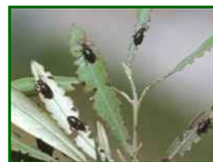
Hojas con insectos

Estos insectos son de costumbres crepusculares y es difícil encontrarlos de día, para cerciorarse de que realmente están presentes se puede colocar una losa o ladrillo cerca de un olivo y se suelen refugiar debajo.