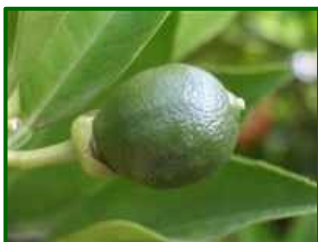
Estado fenológico "I2"

En las Zonas Biológicas de cítricos la temperatura media ha sido 26°C, la media de las temperaturas máximas 32°C y la humedad relativa media el 53%. Estos datos se pueden consultar en la tabla de datos meteorológicos . Según la previsión meteorológica de la próxima semana, la temperatura será superior a la de ésta.