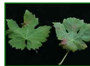
Síntomas en hojas

La araña se localiza en las hojas de la parte inferior de las cepas, lo que nos indica que estos ataques son incipientes. El porcentaje medio provincial de hojas con araña es el 0'7%, el 4,0% en la zona de Antequera y el 0,3% en la de la Axarquía.