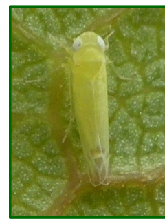
Adulto de mosquito verde

En las parcelas de control no se detecta su presencia en el cultivo pero han comenzado a producirse capturas en las placas cromotrópicas. En la zona biológica de Antequera el índice es de 0'28 adultos por placa y día y 0'23 adultos por trampa y día en la zona biológica de la Axarquía.