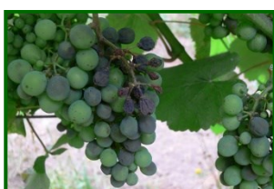
Mildiu larvado en racimo

Esta semana aparecen síntomas de mildiu larvado en racimos de alguna parcela de control perteneciente a la zona biológica de la Axarquía. Se estima un 0'6% de racimos y un 1'5% de cepas con síntomas en esa zona.