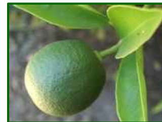
Estado fenológico "J"

El estado fenológico dominante en las parcelas de control se encuentra entre "I2" (cierre del cáliz) y "J" (fruto al 40% desarrollado).