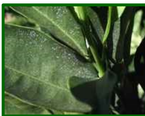
Síntomas en hoja

Se detecta presencia de estos ácaros en algunas parcelas de control, la incidencia sube hasta el 10,5% de hojas con formas móviles.