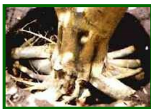
Cuello y raíces afectadas

Se ha evaluado la cantidad de árboles que presentan síntomas de la enfermedad, en las parcelas de control se estima un 2'0% de árboles afectados.