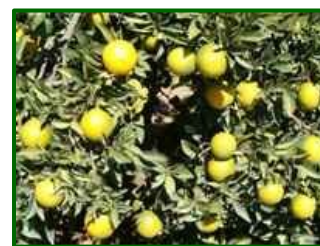
Estado fenológico "K"

El estado fenológico dominante en las parcelas de control se encuentra entre "J" (fruto al 40% desarrollado) y "K" (envero).