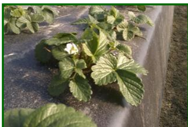
Primeros botones florales

El estado fenológico dominante es B "Aparición de los primeros botones florales" pudiéndose observar en menor medida C "Floración y fructificación" en plantaciones más adelantadas por fecha de plantación y/o maceta-hidropónico.