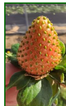
Síntomas S. aurantii

Esta especie, es muy polífaga , se puede encontrar en más de 50 especies de plantas en una amplia gama de diferentes familias, es originaria de África y Yemen , donde está muy extendida y causa daños en cítricos y algo en mango y aguacate. Según normativa europea, está considerado un organismo de cuarentena y, consecuentemente, sometido a regulación, siendo necesario tomar medidas para su erradicación y control. Además, está recogido en la lista A1 de la EPPO (Organización Europea para Protección de las Plantas), la cual recoge los organismos de cuarentena que están ausentes en la región EPPO.