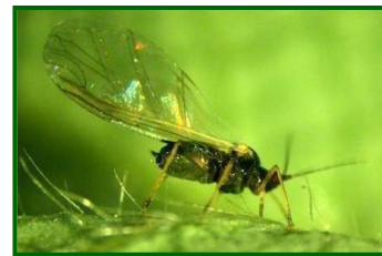
Adulta alada A. gossypii

Según datos históricos, la presencia sobre el cultivo de pulgones (principalmente Aphis gossypii ) comienza a observarse en noviembre , a los pocos días de cubrir la plantación con los túneles. A partir de este mes, su incidencia, expresada en porcentaje de plantas ocupadas , toma una tendencia al alza, modelada principalmente por factores meteorológicos, tratamientos químicos y presencia de fauna auxiliar, hasta alcanzar máximos entre los meses de febrero, marzo y primera quincena de abril . Posteriormente, en la segunda quincena de abril y mayo , su incidencia cae coincidiendo con un ambiente más caluroso y seco y con una población de fauna auxiliar bien establecida. En plena producción se observan, además de A. gossypii , especies como Chaethosyphon fragaefolii , Acirthosyphon rogersii y Macrosyphum euphorbiae . De éstos, destacar C. fragaefolii al formar colonias de difícil control tanto químico como biológico.