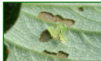
Plusia y daños en hoja

En cuanto a los daños producidos en otoño , destacaron los meses de octubre y noviembre en los que se registró una media del 9.8% de plantas con daños nuevos y/o presencia de larvas , valor que se corresponde con un nivel de intensidad de ataque moderado .