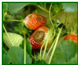
Síntomas de antracnosis

Así, en esta campaña, destacó una mayor incidencia de antracnosis y fitóftora en frutos en los meses de marzo y abril tras algunos días con precipitaciones y temperaturas cálidas para la época, si bien, registrándose valores por debajo del 1% de frutos con síntomas .