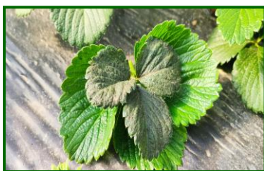
Síntomas S. aurantii

Hasta que no se tengan más datos, todo parece indicar que los periodos críticos son aquellos en los que los cultivos se encuentran en brotación en un ambiente de temperaturas suaves y suficiente humedad relativa , siendo especialmente sensibles aquellas variedades de frutos rojos con una brotación y/o floración más vigorosa .