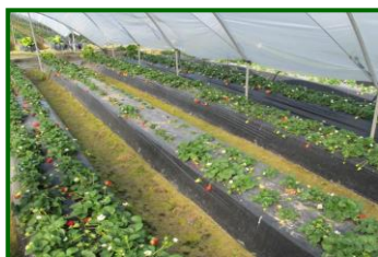
Síntomas por nematodos

Por último, en cuanto a plagas y enfermedades, las principales especies de nematodos asociadas al cultivo de la fresa en Huelva son, por orden de importancia: Meloidogyne hapla y Pratylenchus penetrans .