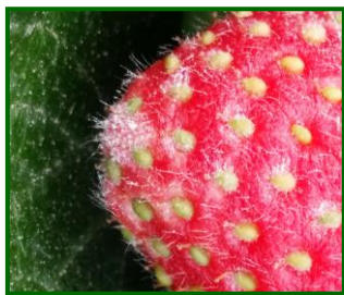
Síntomas de oidio

En esta campaña, por tanto, destacaron los meses de diciembre y enero , en los que las precipitaciones acacidas, junto a temperaturas suaves, aumentaron la presión del oidio , teniéndose que recurrir con frecuencia a su control químico.