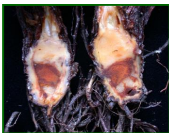
Necrosis en corona

Así, en esta campaña, al elevado porcentaje de marras de plantación registrado por las altas temperaturas durante el trasplante en el inicio del otoño, hubo que sumarle los daños de podredumbre de raíz y cuello favorecidos por los frecuentes riegos aportados.