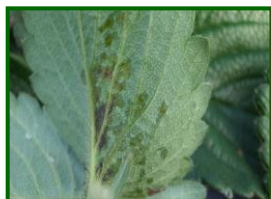
Síntoma de mancha aceitosa

En cuanto a la incidencia de mancha aceitosa ( Xanthomonas fragariae ) y mancha púrpura ( Mycosphaerella fragariae ) , enfermedades favorecidas por temperaturas frescas, destacó su presencia a finales de febrero con valores de plantas con síntomas por debajo del 1% .