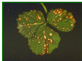
Síntoma de mancha púrpura

Del total de tratamientos fungicidas realizados en la provincia, como enfermedad principal, son escasos los dirigidos al control de estas enfermedades, en todo caso, destacar los dirigidos contra antracnosis y fitóftora.