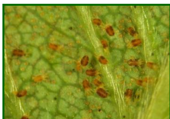
Colonia de araña roja

Así, en octubre , al inicio de la campaña, las primeras estaciones de control monitoreadas registraron valores en torno al 15.6% de hojas Total con presencia de hembras , valor que se corresponde con un nivel de intensidad de ataque moderado en esta época . En noviembre , tras los tratamientos químicos realizados para bajar población, y ya de manera generalizada, la incidencia de araña roja registró valores en torno al 6% , recuperándose a partir de finales de diciembre hasta alcanzar en febrero una media del 13.3% .