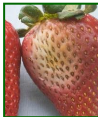
Síntoma de fitóftora

En cuanto a la incidencia de mancha aceitosa ( Xanthomonas fragariae ) y mancha púrpura ( Mycosphaerella fragariae ) , enfermedades favorecidas por temperaturas frescas, destacó su presencia a finales de febrero con valores de plantas con síntomas por debajo del 1% .