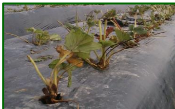
Inicio plantación en octubre

- Octubre de 2022 se caracterizó por alcanzar temperaturas máximas en torno a los 27 °C , lo que representa un aumento respecto al histórico (2000-2021) del +18% . En cuanto a las mínimas , éstas registraron valores en torno a los 15 °C , lo que representa un aumento respecto al histórico (2000-2021) del +23% . Respecto a las precipitaciones , llovió algo más de 7 l/m 2 , siendo éstos inferiores al histórico (2000-2021), en concreto un -84% . Fue, por tanto, un octubre más cálido y seco de lo normal .