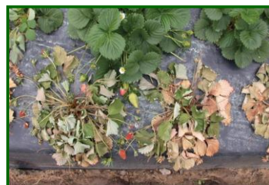
Sintomas de M. phaseolina

Este ambiente cálido y seco , que como se ha dicho se inició a finales del invierno, se extendió a los meses de abril y mayo . Dichas condiciones meteorológicas favorecieron el inicio y desarrollo del hongo patógeno de raíz y cuello Macrophomina phaseolina , convirtiéndolo en un agente causal más del debilitamiento y/o muerte de plantas, registrándose, en este periodo, una incidencia próxima al 2% de plantas afectadas .