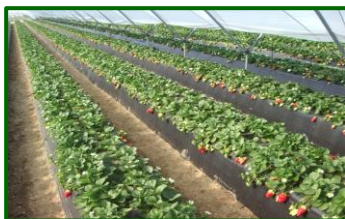
Periodo de recolección desde dic.-enero

- Enero de 2023 destacó por un mantenimiento de las temperaturas máximas suaves, en torno a los 16 °C , lo que representa un aumento respecto al histórico (2000-2022) del +2.3% . En cuanto a las mínimas , éstas, bajaron hasta los 5 °C , fueron, respecto al histórico (2000-2022), un -7% inferiores . Hay que matizar que, la primera quincena de enero fue cálida para la época, mientras que la segunda ha sido fría. Respecto a las precipitaciones , destacó un acumulado medio en torno a los 17 l/m 2 que, respecto al histórico (2000-2022), representa un descenso del -70% . Fue, por tanto, un enero más suave y seco de lo normal, destacando la entrada de un frente frío que duró toda la segunda quincena del mes .