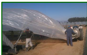
Colocación de plásticos en noviembre

- Noviembre de 2022 se caracterizó por alcanzar temperaturas máximas en torno a los 21 °C , lo que representa un aumento respecto al histórico (2000-2021) del +12% . En cuanto a las mínimas , éstas registraron valores en torno a los 10 °C , lo que representa un aumento respecto al histórico (2000-2021) del +17% . Respecto a las precipitaciones , llovió en torno a los 30 l/m 2 , siendo éstos inferiores al histórico (2000-2021), en concreto un -61% . Fue, por tanto, un noviembre más cálido y seco de lo normal .