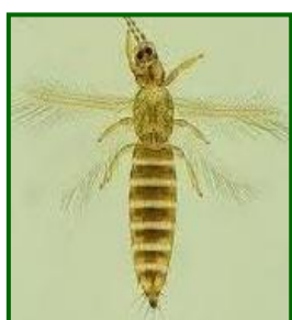
Adulto F. occidentalis

Así, en esta campaña, el repunte de la población de trips se registró a mediados de febrero cuando se registró una media del 5.8% de flores ocupadas .