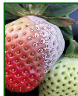
Botrytis en fruto

Así, teniendo en cuenta que ha sido una campaña en general seca , tan solo destacar los daños que esta enfermedad ocasionó, con un bajo nivel de ataque, entre diciembre y enero, y en el mes de marzo , periodos en los que se registraron precipitaciones, especialmente importantes en diciembre, y en los que las temperaturas fueron las favorables para su inicio y desarrollo.