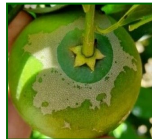
Síntomas en fruto

Scirtothrips aurantii es un trips originario de Sudáfrica que afecta a más de 50 especies vegetales, destacando por su impacto en cítricos. Ataca brotes nuevos, flores y frutos pequeños. Las hembras insertan los huevos en tejidos tiernos; tras su eclosión, las larvas se alimentan de la superficie de hojas y frutos. Luego pasan a estados inmóviles (propupa y pupa) en el suelo o cáliz del fruto, de los que emergen los adultos. Su ciclo puede completarse en 2-3 semanas en condiciones cálidas. En climas suaves como Huelva o Málaga, puede permanecer activo casi todo el año.