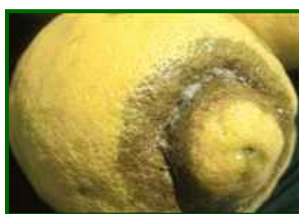
T. urticae Síntomas en fruto

La humedad aún se sitúa en niveles que no impiden su presencia. En zonas interiores del Guadalhorce, donde la humedad mínima es baja, puede mantenerse activa.