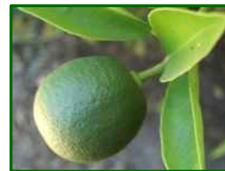
Estado fenológico "J"

El estado fenológico dominante en esta época se es principalmente J (fruto al 40% de desarrollo).