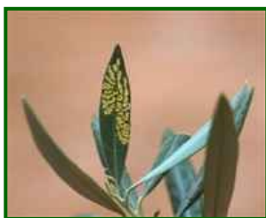
Daños de Glifodes

El porcentaje de brotes de la copa afectados es el 4,1%, como media provincial.