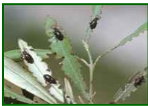
Hojas con insectos

Se ha observado su presencia en el 23% de las 22 parcelas de control analizadas. La media provincial es el 1,4% de brotes de la copa afectados. Destaca la zona biológica Antequera Occidental con el 2,7% de brotes de la copa afectados.