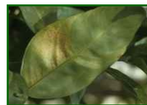
T. urticae Síntomas en hoja

Tetranychus urticae es un ácaro polífago de pequeño tamaño (<0,5 mm), cuya coloración varía del verde-amarillento al rojo intenso en fase de diapausa. Inverna en grietas o bajo hojarasca y,