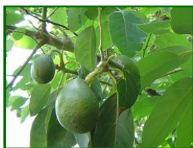
Estado fenológico "J"

Según la Agencia Estatal de Meteorología (AEMET) , en el Guadalhorce las temperaturas mínimas estarán en torno a 19-20 °C y las máximas podrían alcanzar 32-34 °C , con cielos mayormente despejados o poco nubosos y una probabilidad ocasional de lluvias ligeras; el viento soplará flojo a moderado ( \approx SE 15 km/h) en muchas jornadas. En la Axarquía , las mínimas previstas se sitúan entre 17-18 °C y las máximas rondarán 27-29 °C , con humedad relativa que se presenta en rangos como 45 %-95 % , viento suave ( \approx S 10-15 km/h) y sin precipitaciones significativas previstas..