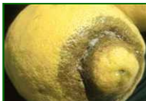
T. urticae Síntomas en fruto

Las condiciones actuales no son favorables para la plaga. La combinación de temperaturas suaves y humedad alta provoca un retroceso claro de las poblaciones, que quedan restringidas a focos residuales en parcelas interiores y soleadas.