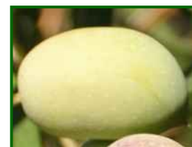
Estado fenológico "11"

En el 49% de las parcelas de control el estado fenológico dominante es "H" (endurecimiento del hueso) y en el 51% es "11" (envero, amarillo). Puede consultar la tabla de estados fenológicos .