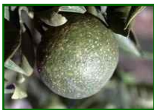
Fruto con piojo rojo

Las temperaturas moderadas y la humedad más elevada son condiciones muy favorables para esta cochinilla. La supervivencia de ninfas móviles aumenta y se facilita el asentamiento en frutos en invierno, que siguen siendo el principal órgano sensible. La presión tenderá a mantenerse alta o incluso incrementarse en huertos con historial de la plaga.