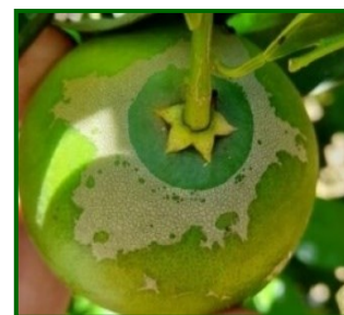
Sintomas en fruto

Scirtothrips aurantii es un trips originario de Sudáfrica que afecta a más de 50 especies vegetales, destacando por su impacto en cítricos. Ataca brotes nuevos, flores y frutos pequeños. Las hembras insertan los huevos en tejidos tiernos; tras su eclosión, las larvas se alimentan de la superficie de hojas y frutos. Luego pasan a estados inmóviles (propupa y pupa) en el suelo o cáliz del fruto, de los que emergen los adultos. Su ciclo puede completarse en 2–3 semanas en condiciones cálidas. En climas suaves como Huelva o Málaga, puede permanecer activo casi todo el año.