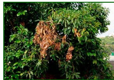
Síntomas en ramas

Descripción y biología del agente causal. Los patógenos de la familia Botryosphaeriaceae comprenden varios géneros de hongos ascomycetos que actúan como oportunistas y pueden permanecer latentes en tejidos asintomáticos. Bajo condiciones de estrés, estos hongos emergen y colonizan el xilema y el parénquima, causando necrosis en ramas y troncos. Su ciclo de vida incluye la producción de esporas que se dispersan por el aire y el agua, facilitando la infección.