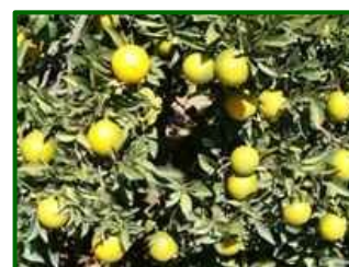
Estado fenológico "K"

El estado fenológico dominante en esta época es J (fruto al 40% de desarrollo) y en las variedades tempranas el envero .