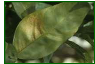
T. urticae Síntomas en hoja

La araña roja podría reactivarse ligeramente en las zonas interiores más secas, mientras que en el litoral su incidencia seguirá siendo baja. Las humedades mínimas más bajas y el leve ascenso térmico mejoran sus condiciones de actividad, aunque el entorno general aún no es completamente favorable.