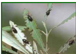
Hojas con insectos

Se ha observado su presencia en el 23% de las 22 parcelas de control analizadas. La media provincial es el 1,4% de brotes de la copa afectados. Destaca la zona biológica Antequera Occidental con el 2,7% de brotes de la copa afectados.