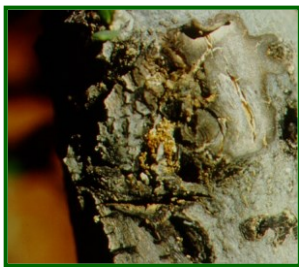
Excrementos de larvas

Aparecieron daños en el 15% de las 40 parcelas de control analizadas. La media provincial es menor a 0,1 galerías por árbol.