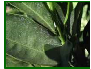
Síntomas en hoja

Los ácaros del género Eutetranychus constituyen un grupo de tetránquidos que pueden causar daños considerables en cítricos, especialmente en condiciones cálidas. Se caracterizan por su reducido tamaño, coloración variable entre verdosa y anaranjada y por formar colonias en el envés de las hojas, donde succionan el contenido celular. Su presencia suele detectarse por la aparición de manchas cloróticas difusas que progresan hasta provocar un aspecto bronceado y necrosis parcial en el limbo foliar.