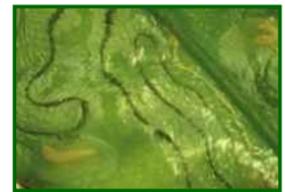
Larva de minador en hoja

El control químico solo debe aplicarse en viveros o árboles jóvenes, con productos sistémicos o translaminares al inicio de la brotación. En plantaciones adultas, se acepta cierto nivel de daño para preservar el equilibrio biológico y reducir la presión del minador de forma natural.