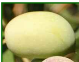
Estado fenológico "11"

Según la Agencia Estatal de Meteorología (AEMET) , las temperaturas previstas oscilan entre 16 °C y 32 °C , con mínimas nocturnas sobre 15-17 °C y máximas diurnas hasta 32 °C . La humedad relativa se moverá en rangos entre 20 % y 55 % durante el día y podrá alcanzar hasta 85 % o más en las horas nocturnas. El viento soplará de componente sur con velocidades que podrían llegar a 35 km/h en algunos intervalos. No se prevén precipitaciones significativas.