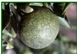
Fruto con piojo rojo

Temperaturas diurnas cercanas a 27–28 °C y humedad relativa media en torno al 65–69 % son un marco cómodo para que se mantenga activo. La mayor humedad mejora la supervivencia de ninfas móviles y el envero aumenta la receptividad del fruto. Es posible que se mantenga la presión e incluso leve repunte en parcelas con historial.