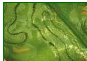
Larva de minador en hoja

Phyllocnistis citrella es una pequeña polilla originaria de Asia, muy específica de cítricos. Los adultos son de hábitos nocturnos y colocan sus huevos en el envés de hojas tiernas. Las larvas, al emerger, se alimentan del tejido foliar excavando minas serpenteantes bajo la epidermis, visibles como líneas plateadas. Tras completar su desarrollo, la larva se enrolla en el borde de la hoja para pupar. El ciclo puede durar desde dos semanas (en verano cálido) hasta dos meses (en clima fresco). En zonas mediterráneas, tiene múltiples generaciones desde primavera hasta otoño, desapareciendo en invierno frío.