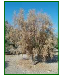
Olivo con síntomas

El hongo Verticillium dahliae es un patógeno de tipo soilborne, lo que significa que reside en el suelo durante largos periodos. Este hongo se desarrolla principalmente en suelos cálidos, con temperaturas que oscilan entre 20 y 30 °C, y puede sobrevivir durante años en el suelo en forma de esporas. La infección se inicia cuando las esporas del hongo entran en contacto con las raíces del olivo, especialmente cuando estas están dañadas o debilitadas. Una vez dentro de la planta, el hongo se desplaza a lo largo de los conductos vasculares, donde se multiplica y causa obstrucción. Como resultado, los tejidos de la planta no reciben suficiente agua y nutrientes, lo que provoca un marchitamiento progresivo de las hojas y una reducción en el rendimiento.