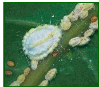
Hembra adulta y ninfas

Aspectos biológicos: Se trata de una especie partenogenética (reproducción por doncellas) esto quiere decir que hay momentos en que las hembras solas pueden producir una nueva generación (haploide) que puede ser muy numerosa con el objeto de colonizar rápidamente y con gran número de individuos. Las hembras tienen un ovisaco, como en el caso de la cochinilla acanalada de los cítricos, pero de tamaño más pequeño.