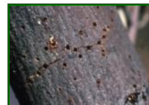
Orificios de salida

Su biología incluye varias generaciones al año, dependiendo de la temperatura. Los adultos emergen en primavera y buscan lugares favorables para la puesta, como ramas cortadas, troncos debilitados o madera muerta. Excavan galerías de nutrición y reproducción bajo la corteza, donde las hembras depositan los huevos. Las larvas se alimentan del tejido subcortical, formando galerías perpendiculares a las maternas. Tras completar su desarrollo, se transforman en pupas y luego emergen como adultos, repitiendo el ciclo.