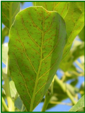
Ácaro cristalino, síntomas

La media provincial de hojas con formas móviles sube hasta el 68,9%. En el Guadalhorce un 34,4% y en la Axarquía el 77,5%. Aparece en las 20 parcelas de control analizadas.