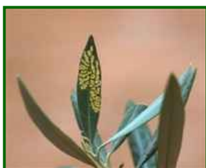
Daños de Glifodes

El porcentaje de brotes de la copa afectados que se alcanzó fue el 4,1%, como media provincial.