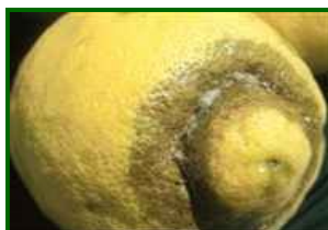
T. urticae Síntomas en fruto

Penalizada por la subida de la humedad (mínimas 41–48 %). Las temperaturas suaves limitan su multiplicación rápida. Se espera retroceso general, quedando focos residuales en interiores soleados (Guadalhorce).