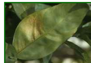
T. urticae Síntomas en hoja

Penalizada por la subida de la humedad (mínimas 41–48 %). Las temperaturas suaves limitan su multiplicación rápida. Se espera retroceso general, quedando focos residuales en interiores soleados (Guadalhorce).