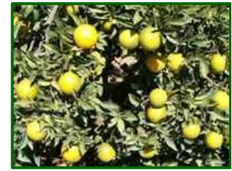
Estado fenológico "K"

El estado fenológico dominante en esta época es J (fruto al 40% de desarrollo), van aumentando las parcelas que alcanzan el envero.