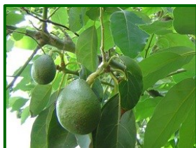
Estado fenológico "J"

Según la Agencia Estatal de Meteorología (AEMET) , se espera tiempo estable: las temperaturas oscilarán entre mínimas de 17–20 °C y máximas de 27–34 °C (más altas en El Guadalhorce y más suaves en la Axarquía). La humedad relativa presentará valores diurnos moderados (≈35–55 %) y ascenderá en la noche hasta 70–95 % según jornadas. El viento soplará flojo a moderado (≈10–20 km/h), con predominio de E–SE en litoral y componentes locales variables en el interior; se producirán variaciones puntuales de dirección y rachas. La precipitación será baja en conjunto, con probabilidad reducida y, como mucho, algún episodio aislado.