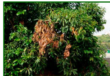
Síntomas en ramas

Descripción y biología del agente causal. Los patógenos de la familia Botryosphaeriaceae comprenden varios géneros de hongos ascomycetos que actúan como oportunistas y pueden permanecer latentes en tejidos asintomáticos. Bajo condiciones de estrés, estos hongos emergen y colonizan el xilema y el parénquima, causando necrosis en ramas y troncos. Su ciclo de vida incluye la producción de esporas que se dispersan por el aire y el agua, facilitando la infección.