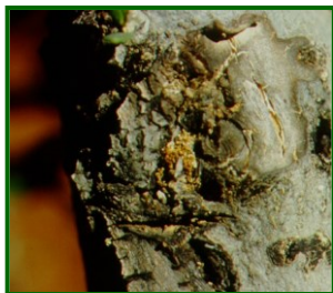
Excrementos de larvas

Aparecieron daños en el 15% de las 40 parcelas de control analizadas. La media provincial es menor a 0,1 galerías por árbol.