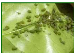
Colonia de pulgones en hoja

Con temperaturas moderadas y menor brotación activa, su ritmo de aumento es bajo. La humedad relativa alta no dispara las poblaciones por sí sola en esta fase. Incidencia baja, restringida a focos en brotes tiernos residuales.