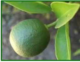
Estado fenológico "J"

El estado fenológico dominante en esta época es J (fruto al 40% de desarrollo), van aumentando las parcelas que alcanzan el envero.