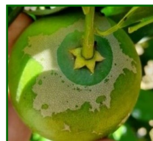
Síntomas en fruto

Scirtothrips aurantii es un trips originario de Sudáfrica que afecta a más de 50 especies vegetales, destacando por su impacto en cítricos. Ataca brotes nuevos, flores y frutos pequeños. Las hembras insertan los huevos en tejidos tiernos; tras su eclosión, las larvas se alimentan de la superficie de hojas y frutos. Luego pasan a estados inmóviles (propupa y pupa) en el suelo o cáliz del fruto, de los que emergen los adultos. Su ciclo puede completarse en 2–3 semanas en condiciones cálidas. En climas suaves como Huelva o Málaga, puede permanecer activo casi todo el año.