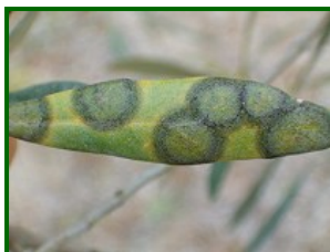
Hoja con síntomas

Se ha evaluado la situación al inicio del otoño, los datos obtenidos son: