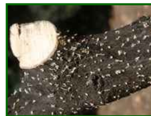
Orificios de entrada

El barrenillo del olivo ( Phloeotribus scarabaeoides ) es un coleóptero de la familia Curculionidae, subfamilia Scolytinae, considerado una de las principales plagas de los olivos en climas mediterráneos. Ataca especialmente a árboles debilitados, mal gestionados o con presencia de ramas secas y restos de poda sin eliminar.