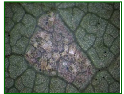
Diferentes estadios de desarrollo del ácaro