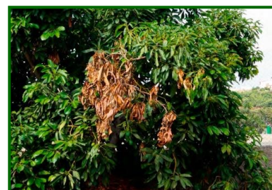
Sintomas en ramas

Descripción y biología del agente causal. Los patógenos de la familia Botryosphaeriaceae comprenden varios géneros de hongos ascomycetos que actúan como oportunistas y pueden permanecer latentes en tejidos asintomáticos. Bajo condiciones de estrés, estos hongos emergen y colonizan el xilema y el parénquima, causando necrosis en ramas y troncos. Su ciclo de vida incluye la producción de esporas que se dispersan por el aire y el agua, facilitando la infección.