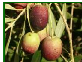
Estado fenológico "12"

En el 60% de las parcelas de control, el estado fenológico dominante es 11 (envero); en el 40% es 12 envero (manchas rojas). Se puede consultar la tabla de estados fenológicos . Es de destacar la pérdida de turgencia en el fruto en los olivares de secano, compatible con síntomas de estrés hídrico asociados a la persistente ausencia de precipitaciones.