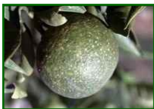
Fruto con piojo rojo

Con días de 26–27 °C y humedad relativa media del 62–69 %, el ciclo se mantiene activo. La humedad mejora la supervivencia de ninfas móviles y el envero aumenta la receptividad del fruto. Las lloviznas son demasiado débiles para afectar las colonias. Se prevé presión sostenida, algo más alta en Estepona.