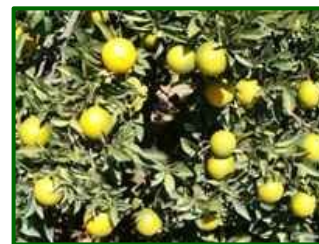
Estado fenológico "K"

El estado fenológico dominante en esta época se encuentra entre J (fruto al 40% de desarrollo) y K (envero) en función de la variedad.