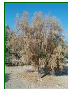
Olivo con síntomas

El hongo Verticillium dahliae es un patógeno de tipo soilborne, lo que significa que reside en el suelo durante largos periodos. Este hongo se desarrolla principalmente en suelos cálidos, con temperaturas que oscilan entre 20 y 30 °C, y puede sobrevivir durante años en el suelo en forma de esporas. La infección se inicia cuando las esporas del hongo entran en contacto con las raíces del olivo, especialmente cuando estas están dañadas o debilitadas. Una vez dentro de la planta, el hongo se desplaza a lo largo de los conductos vasculares, donde se multiplica y causa obstrucción. Como resultado, los tejidos de la planta no reciben suficiente agua y nutrientes, lo que provoca un marchitamiento progresivo de las hojas y una reducción en el rendimiento.