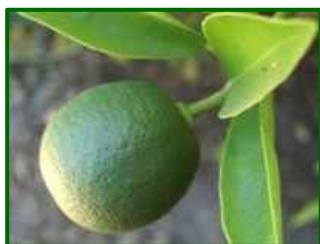
Estado fenológico "J"

pueden alcanzar los 40 km/h en Estepona y 50 km/h en Vélez-Málaga, con direcciones variables, generalmente de componente Este o del Norte en el interior.