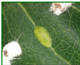
Hembra joven y otras con ovisaco

Esta cochinilla es un coccido que se detectó por primera vez en la península ibérica en 2017 en plantaciones de mango, se cita su presencia, en la bibliografía, en numerosas especies.