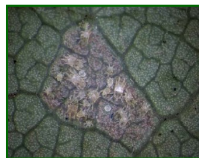
Diferentes estadios de desarrollo del ácaro