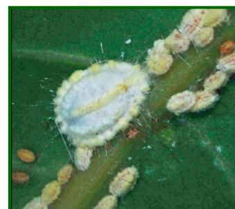
Hembra adulta y ninfas