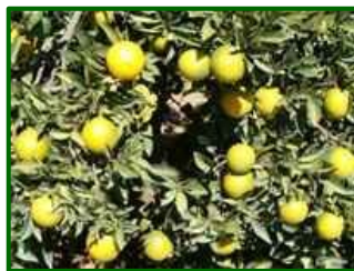
Estado fenológico "K"

Estepona y la Axarquía. La probabilidad de precipitación es alta, con valores que van del 65% al 95% en distintos tramos horarios, especialmente durante tardes y noches, anticipando episodios de lluvia frecuentes y persistentes.