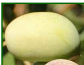
Estado fenológico "I2"

Según la previsión meteorológica de la AEMET en las zonas de olivar de Antequera y Ronda se espera un tiempo plenamente otoñal, con temperaturas máximas entre 18 y 22 °C y mínimas de 6 a 12 °C, ligeramente más frías en zonas interiores y altas de la Serranía de Ronda y Antequera Occidental, algo más templadas en Antequera Norte. La humedad relativa se mantiene elevada, generalmente entre el 65% y el 95%, con madrugadas húmedas y posibles sensaciones de bochorno en las horas centrales si se abren claros. El viento soplará de norte a noroeste con intervalos de suroeste, de 10 a 25 km/h y rachas puntuales algo superiores en áreas expuestas. La probabilidad de precipitación será moderada-alta, con picos en tardes y noches, favoreciendo episodios de lluvia intermitente.