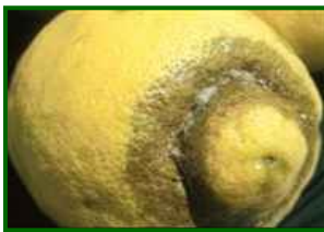
T. urticae Síntomas en fruto

Plaga asociada a sequedad. La humedad persistente y la lluvia dañan telas y favorecen la mortalidad. Con poco calor, no se recupera. Tendencia de fuerte descenso.