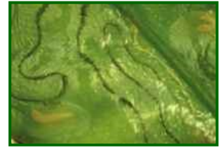
Larva de minador en hoja

Phyllocnistis citrella es una pequeña polilla originaria de Asia, muy específica de cítricos. Los adultos son de hábitos nocturnos y colocan sus huevos en el envés de hojas tiernas. Las larvas, al emerger, se alimentan del tejido foliar excavando minas serpenteantes bajo la epidermis, visibles como líneas plateadas. Tras completar su desarrollo, la larva se enrolla en el borde de la hoja para pupar. El ciclo puede durar desde dos semanas (en verano cálido) hasta dos meses (en clima fresco). En zonas mediterráneas, tiene múltiples generaciones desde primavera hasta otoño, desapareciendo en invierno frío.