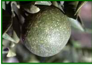
Fruto con piojo rojo

El ambiente fresco, con temperaturas máximas próximas a 20 °C y mínimas alrededor de 11–12 °C, ralentiza el desarrollo de la plaga. La humedad relativa elevada favorece la supervivencia en refugios, pero el frío nocturno prolonga los ciclos y reduce la dispersión. Las lluvias intensas desprenden ninfas expuestas. Se espera una tendencia descendente.