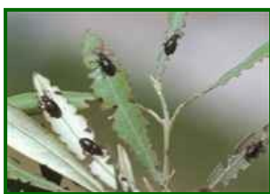
Hoias con insectos

Se ha observado su presencia en el 23% de las 22 parcelas de control analizadas. La media provincial es el 1,4% de brotes de la copa afectados. Destaca la zona biológica Antequera Occidental con el 2,7% de brotes de la copa afectados.