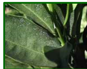
Síntomas en hoja

Los ácaros del género Eutetranychus constituyen un grupo de tetraníquidos que pueden causar daños considerables en cítricos, especialmente en condiciones cálidas. Se caracterizan por su reducido tamaño, coloración variable entre verdosa y anaranjada y por formar colonias en el envés de las hojas, donde succionan el contenido celular. Su presencia suele detectarse por la aparición de manchas cloróticas difusas que progresan hasta provocar un aspecto bronceado y necrosis parcial en el limbo foliar.