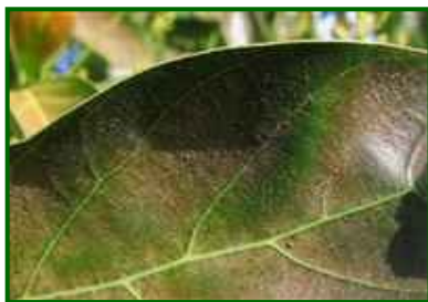
Hoja con araña parda

La media provincial de brotes con formas móviles es el 12,7%. En el Guadalhorce un 6,7% y en la Axarquía el 14,7%. Aparece en las 16 parcelas de control analizadas.