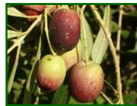
Estado fenológico "I2"

En el 38% de las parcelas de control, el estado fenológico dominante es I2 envero (manchas rojas), en el 62% es J1 (fruto maduro, pulpa blanca). Se puede consultar la tabla de estados fenológicos . Conviene destacar que esta fenología está adelantada respecto a la fenología media del cultivo en nuestra provincia.