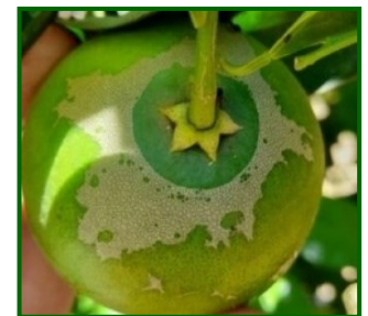
Síntomas en fruto

Scirtothrips aurantii es un trips originario de Sudáfrica que afecta a más de 50 especies vegetales, destacando por su impacto en cítricos. Ataca brotes nuevos, flores y frutos pequeños. Las hembras insertan los huevos en tejidos tiernos; tras su eclosión, las larvas se alimentan de la superficie de hojas y frutos. Luego pasan a estados inmóviles (propupa y pupa) en el suelo o cáliz del fruto, de los que emergen los adultos. Su ciclo puede completarse en 2–3 semanas en condiciones cálidas. En climas suaves como Huelva o Málaga, puede permanecer activo gran parte del año.