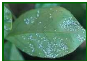
Colonia de mosca blanca

La humedad elevada favorece su persistencia, pero las lluvias intensas lavan adultos y melaza y dañan ninfas expuestas. Previsión de descenso, aunque con focos persistentes en refugios.