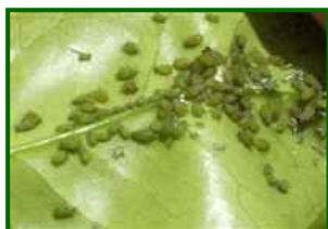
Colonia de pulgones en hoja

Con poca brotación, temperaturas frescas y lluvias intensas, las colonias no prosperan. Actividad muy baja.