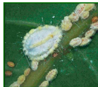
Hembra adulta y ninfas

Aspectos biológicos: Se trata de una especie partenogenética (reproducción por doncellas), esto quiere decir que hay momentos en que las hembras solas pueden producir una nueva generación (haploide) que puede ser muy numerosa con el objeto de colonizar rápidamente y con gran número de individuos. Las hembras tienen un ovisaco, como en el caso de la cochinilla acanalada de los cítricos, pero de tamaño más pequeño.