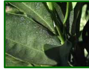
Síntomas en hoja

Los ácaros del género Eutetranychus constituyen un grupo de tetránquidos que pueden causar daños considerables en cítricos, especialmente en condiciones cálidas. Se caracterizan por su reducido tamaño, coloración variable entre verdosa y anaranjada y por formar colonias en el envés de las hojas, donde succionan el contenido celular. Su presencia suele detectarse por la aparición de manchas cloróticas difusas que progresan hasta provocar un aspecto bronceado y necrosis parcial en el limbo foliar.