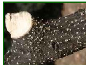
Orificios de entrada

El momento en que se ocasionan los daños es justo tras la salida de una nueva generación de la leña de la poda. Ahora los adultos se dirigen a los restos de poda para efectuar galerías donde reproducirse y se están detectando entradas en los palos cebo colocados.