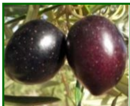
Estado fenológico "J1"

Según la previsión meteorológica de la AEMET en las zonas de olivar de Antequera y Ronda se espera un ambiente otoñal con temperaturas máximas que oscilan entre 14 y 17 °C y mínimas de 3 a 7 °C, con variaciones según municipio: más frías en Antequera Occidental y Ronda, algo más suaves en Antequera Norte. La humedad relativa se mantiene elevada, con valores entre el 55% y el 100%, generando sensación de ambiente húmedo en madrugadas y bochorno ocasional en las horas centrales si se abren claros. El viento soplará con predominio de componentes norte y noroeste, alcanzando intensidades de 10 a 25 km/h, con rachas más notables en zonas expuestas. La probabilidad de precipitación será moderada a alta, con intervalos del 45% al 95%.