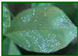
Colonias de mosca blanca

La humedad relativa elevada favorece la persistencia de colonias en el envés de las hojas y en brotes protegidos, pero las temperaturas frescas ralentizan el ciclo de la plaga. Las lluvias ligeras y el rocío contribuyen a lavar melaza y adultos expuestos, de modo que la expresión de los síntomas puede disminuir, aunque las colonias internas no desaparezcan del todo. Previsión: ligero descenso o estabilidad en niveles bajos , con focos en árboles de copa densa y zonas abrigadas.