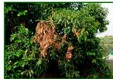
Síntomas en ramas

Descripción y biología del agente causal. Los patógenos de la familia Botryosphaeriaceae comprenden varios géneros de hongos ascomycetos que actúan como oportunistas y pueden permanecer latentes en tejidos asintomáticos. Bajo condiciones de estrés, estos hongos emergen y colonizan el xilema y el parénquima, causando necrosis en ramas y troncos. Su ciclo de vida incluye la producción de esporas que se dispersan por el aire y el agua, facilitando la infección.