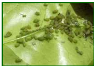
Colonia de pulgones en hoja

Con poca brotación tierna disponible, temperaturas frescas y episodios de lluvia, las colonias de pulgones no se consolidan fácilmente. Los alados tienen más dificultad para colonizar nuevas plantas, y la plantación no ofrece un gran atractivo en este momento fenológico. Previsión: muy baja , limitada a pequeños focos en brotes aislados o en zonas muy resguardadas.