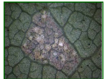
Diferentes estadios de desarrollo del ácaro