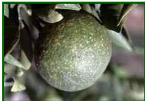
Fruto con piojo rojo

Las temperaturas máximas cercanas a 19 °C y las mínimas entre 6 y 8 °C ralentizan de forma clara el desarrollo de la plaga. La humedad relativa media relativamente alta favorece la supervivencia de ninfas en refugios de corteza y pedúnculos, pero el frío nocturno alarga la duración de los estadios y limita la colonización de nuevos frutos. Las precipitaciones débiles no son suficientes para limpiar por completo colonias, aunque pueden desprender ninfas muy expuestas. Previsión: tendencia a la baja o estabilidad en niveles bajos , con presencia sobre todo en focos bien establecidos.