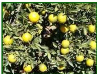
Estado fenológico "K"

es moderada a alta, con intervalos del 45% al 95%, especialmente en tardes y noches, anticipando episodios de lluvia intermitente y persistente.