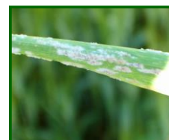
Oídio en hoja

Desde ahijado hasta floración se muestrea la posible presencia de oídio ( Blumerias graminis ). En la provincia de Sevilla y a primeros de abril se alcanza el máximo, un 3,06 % de superficie de plantas con micelio, porcentaje muy por debajo del registrado el año anterior. En Córdoba se alcanza el máximo, 2,04 %, a mediados del mismo mes (dos semanas más tardes que en 2017).