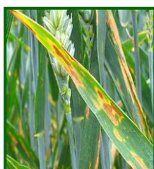
Síntomas de septoria

Desde ahijado hasta floración se muestrea la posible presencia de oídio ( Blumerias graminis ). En la provincia de Sevilla y a primeros de abril se alcanza el máximo, un 3,06 % de superficie de plantas con micelio, porcentaje muy por debajo del registrado el año anterior. En Córdoba se alcanza el máximo, 2,04 %, a mediados del mismo mes (dos semanas más tardes que en 2017).