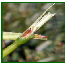
Pupas de Mayetiola

En general, la campaña 2017/2018 se ha caracterizado por una baja incidencia de plagas y enfermedades , han destacado los daños de septoria, algo de oídio y helmintosporium y en Córdoba también un poco de oídio.