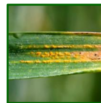
Síntomas de roya

En Córdoba, el máximo valor medio provincial registrado fue del 1% de superficie de plantas con pústulas (0% la anterior campaña), detectado también a primeros de abril, y observándose esta enfermedad en el 15% de parcelas muestreadas en esta provincia.