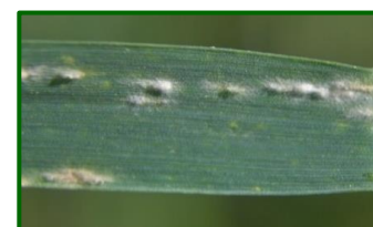
Oidio en hoja

Desde ahijado hasta floración se muestreó la posible presencia de esta enfermedad en el cultivo. De las observaciones realizadas en las parcelas de seguimiento han destacado los valores registrados en la provincia de Córdoba, apreciándose un máximo valor de la media provincial en la segunda mitad de marzo con un 3,4% de superficie de plantas con micelio (nula presencia la campaña anterior).