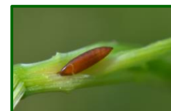
Mosquito del trigo

En Córdoba no se ha observado presencia alguna de esta plaga en ninguna de las parcelas muestreada esta campaña, al igual que la anterior.