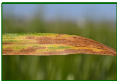
Síntomas de septoria

En ambas provincias, la incidencia de septoria ha sido alta durante gran parte del periodo de muestreo, que abarcaba desde el ahijado hasta la maduración del grano de trigo. Las precipitaciones de la primavera favorecieron el desarrollo y expansión de esta importante enfermedad sobre el cultivo.