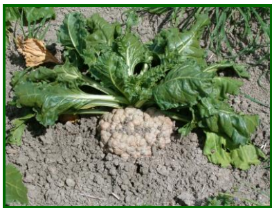
Síntomas de Lepra en corona

Debido a las escasas precipitaciones de este año, sobre todo en Sevilla, el encharcamiento que ha sufrido el cultivo ha sido bajo, y esta circunstancia es poco favorable para el desarrollo de esta enfermedad.