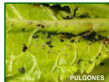
Colonia de pulgones

El máximo de presencia de la campaña se produjo en ambas provincias remolacheras a mediados de abril, con unas medias provinciales de 2'5 colonias (de más de 25 pulgones) por UM en Sevilla y 2'2 en Cádiz; superándose por estas fechas el umbral de tratamiento (5 colonias por U.M.) en algunas parcelas.