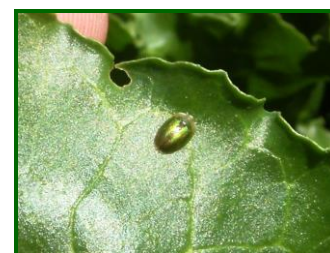
Adulto de Cásida

A partir de mediados de junio descendieron los niveles de adultos de este agente, por debajo de los 20 adultos por UM en ambas provincias, permaneciendo su presencia inferior a este valor durante el resto de la campaña.