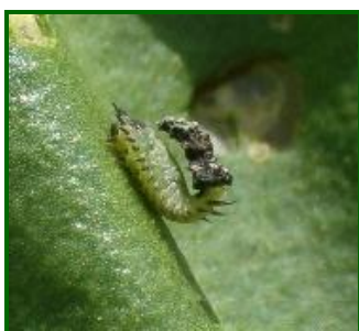
Larva de Cásida

Referente a las puestas y larvas de esta plaga, el máximo de presencia de la campaña se alcanzó en la primera quincena de abril, en ambas provincias remolacheras, con un valor medio provincial de 41 huevos+larvas por UM en Sevilla y 39 en Cádiz. Estando sus niveles durante el resto de la campaña en torno a los 20-25 huevos+larvas por UM, de media provincial.