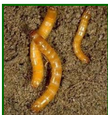
Gusanos de alambre

Para prevenir el ataque de gusanos de alambre, coincidiendo con la siembra del cultivo, se procedió a la aplicación de dos tipos de insecticidas granulados: Teflutrín o Clorpirifos, realizándose tratamiento químico en el 56'3% de las parcelas de Cádiz y en el 48% de las de Sevilla.