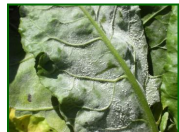
Oidio en hoja

En Cádiz no se han realizado tratamientos contra este hongo, mientras que en Sevilla se ha efectuados éstos en el 7% de las parcelas. Las materias activas más utilizadas han sido: Azufre, Ciproconazol+Trifloxistrobin, y Difenconazol+Fenpropidin.