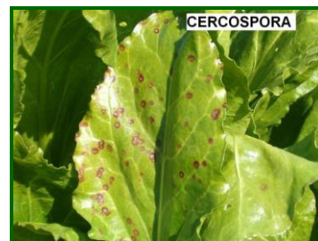
Manchas de Cercospora

Los primeros tratamientos fungicidas contra este hongo, en Sevilla, se realizaron a principios de marzo, y a primeros de abril en Cádiz.