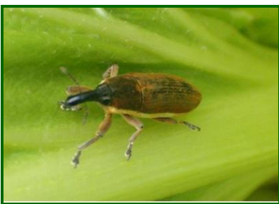
Adulto de Lixus

En Cádiz, los primeros adultos de lixus se observaron a finales de febrero, y en Sevilla a primeros de ese mes. El primer máximo de presencia se produjo en Cádiz a mediados de marzo, con una media provincial de 3 adultos por U.M. (Unidad de Muestreo=50 plantas); mientras que en Sevilla este primer máximo se observó a mediados de mayo, con 10 adultos por U.M.