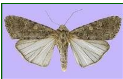
Adulto de Spodoptera exigua

Las primeras larvas de noctuidos defoliadores de la campaña se observaron en el mes de noviembre, tanto en Cádiz como en Sevilla, en los primeros estados vegetativos del cultivo, con niveles de presencia muy bajos, de 5 larvas pequeñas por UM en Sevilla y 1 en Cádiz.