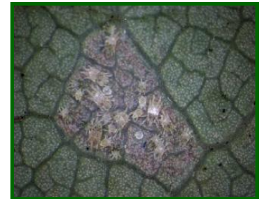
Diferentes estadios de desarrollo del ácaro

Los formulados autorizados contra él son a base de abamectina, azadiractín o azufre. Es imprescindible, a la hora de hacer una intervención química, comprobar que los nidos están ocupados por formas vivas del ácaro , y en cantidad suficiente, porque hojas con síntomas se suelen encontrar todo el año.