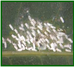
Grupo de machos en hoja

La cochinilla de la nieve recibe su nombre por el color blanco que presenta. Los machos tienen forma alargada y suelen presentarse agrupados; existe un gran dimorfismo sexual, las hembras son redondeadas y suelen aparecer aisladas unas de otras.