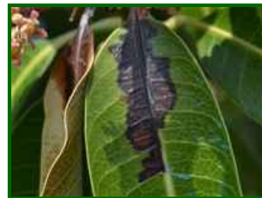
Síntomas en hoja

Los formulados autorizados contra esta enfermedad contienen oxiclورو de cobre o sulfato tribásico de cobre.