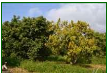
Árbol sano / árbol afectado

Respecto a las enfermedades, la más importante es la tristeza del aguacate , causada por el hongo del suelo Phytophthora cinnamomi .