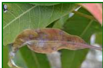
Síntomas en hoja nueva