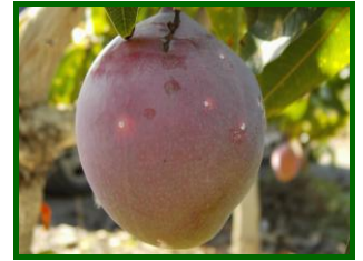
Hembras, en fruto

El principal daño que produce es una depreciación del fruto cuando se establecen algunos individuos en él porque lo decoloran y no madura adecuadamente. Basta la presencia de cuatro o cinco cochinillas para que un fruto no valga comercialmente.