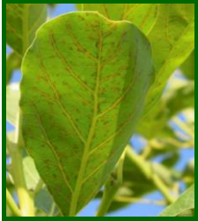
Ácaro cristalino, síntomas

De los agentes mencionados solamente se ha detectado presencia de los dos ácaros.