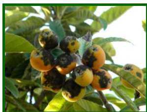
Frutos afectados por moteado

Moteado, roña ó negra del níspero ( Fusicladium eryobotryaea ): Destaca sobre las demás enfermedades, debido a los daños que produce sobre la piel de los frutos, provocando manchas de color pardo-negruzco en hojas y frutos que deprecian totalmente el fruto. Las condiciones climáticas otoñales, con presencia de lluvias acompañadas de alta humedad y temperaturas medias, hacen que sean favorables para el desarrollo del hongo, afectando al tejido epidérmico de los frutos en desarrollo y si el ataque se produce precozmente, el fruto puede llegar a cuartearse.