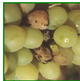
Daños por Aspergillus niger

En Huelva se observaron a mediados de agosto los primeros daños por podredumbre gris ( Botrytis cinerea ). En ese momento, éstos fueron poco importantes, inferiores al 1% de racimos afectados, situación que se mantuvo hasta finales de mes. Una vez que los racimos entraron en la fase de maduración a finales de agosto y septiembre y debido, principalmente, a la rotura de éstos ocasionada por mildiu, oidio, polillas del racimo, melazo y/o alto grado de compactación de los racimos, se observaron a principios de septiembre más daños por podredumbre gris ( Botrytis cinerea ), poco importantes, en torno al 2'2% de racimos afectados. A finales de mes, el porcentaje varió poco, siendo