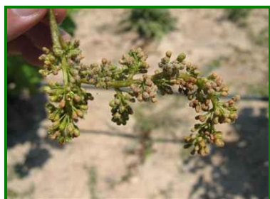
Síntomas en racimo

En los racimos, los síntomas en las proximidades de la floración se manifiestan por curvaturas y oscurecimientos del raquis o raspajo y su posterior recubrimiento de una pelusilla blanquecina si el tiempo es húmedo, ocurriendo lo mismo en flores y granos recién cuajados. Cuando los granos superan el tamaño de un guisante no se oscurecen, ni aparece la pelusilla blanquecina, sino que se arrugan y finalmente se desecan, conociéndose como " mildiu larvado ".