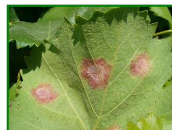
Síntomas de mildiu en el envés

registró a principios de abril , a nivel provincial, un 4% de cepas afectadas, un 1% de hojas con síntomas y un 0% de racimos con síntomas . Situación que evolucionó hasta alcanzar valores de 5'2% de cepas afectadas, un 1'7% de hojas con síntomas y un 0'5% de racimos con síntomas en la segunda semana de abril; 8'7% de cepas afectadas, un 3% de hojas con síntomas y un 1% de racimos con síntomas, en la tercera semana, y 28'8% de cepas afectadas, un 4% de hojas con síntomas y un 1'8% de racimos con síntomas a finales del mes de abril .