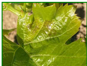
Síntomas de araña amarilla en haz

Un factor a tener en cuenta en la dinámica poblacional de la araña amarilla es la presencia-ausencia de plantas adventicias en el entorno de las parcelas , al ser éstas el principal reservorio de la plaga. Pasa la araña el invierno como hembra adulta protegida en diversos refugios: corteza de las cepas, suelo, hojarasca... Este agente se puede ver a simple vista como unos pequeños puntos rojizos en las hojas o en los tallos; los adultos miden alrededor de 0,5 mm. Estos ácaros extienden una pequeña telaraña debajo de las hojas. Es un ácaro muy polífago, se puede alimentar de cientos de tipos de plantas, incluyendo la vid. Durante el verano, T. urticae tiene una coloración marrón verdosa con dos manchas más oscuras en los laterales, pero cuando se aproxima el invierno, su coloración se aproxima al rojo intenso. Las altas temperaturas y la ausencia de lluvias favorecen la supervivencia de los individuos.