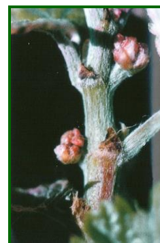
Erinosis (raza de las yemas)

Cádiz, Huelva y Málaga se detectó la que más tarde, se localiza en las hojas produciendo agallas , no habiéndose observado, por tanto, la raza del curvado de las hojas.