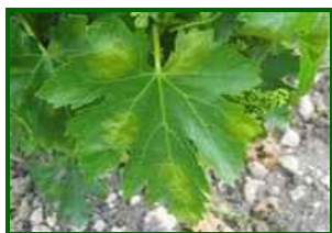
Mildiu, mancha de aceite

En Córdoba aparecieron las siguientes manchas esporuladas de mildiu en los Términos Municipales de Montemayor (12 de abril) y Montilla (13 de abril). En los muestreos de las parcelas que forman parte de la RAIF, se alcanzó una media provincial de cepas afectadas 2% . Alcanzando un máximo puntual de 5% de cepas afectadas.