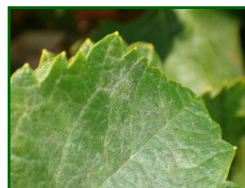
Síntomas de oidio en hoja

Las estrategias y medios de lucha contra el oidio , son los de emplear la poda en verde para aumentar la aireación, ya que se crea un ambiente poco favorable al desarrollo del hongo y por otra parte favorece la penetración de los fungicidas y el control químico . Es importante en este último caso, alternar diferentes productos sistémicos para evitar resistencias. Determinadas técnicas de cultivo pueden reducir la severidad de esta enfermedad y aumentar la efectividad del control químico o biológico. El empleo de sistemas de conducción que permitan una buena circulación de aire a través de la vegetación e impida el exceso de sombreado es muy beneficioso. Mantener una copa vegetativa abierta mediante deshojado, desnietado y despampanado no solo mantiene un microclima más desfavorable para el desarrollo del hongo, sino que, además, permite la mejor penetración del producto fungicida empleado.