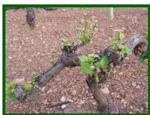
Cepa dañada por conejos.

Se detectaron cepas dañadas por estos mamíferos en las provincias de Córdoba y Málaga en el mes de abril. Destacó Córdoba , donde comenzaron los daños con un 4% de cepas afectadas a mediados de mes, hasta alcanzar el 10% a finales de mes. Los Llanos y Las Arenas presentaron máximos de 12% y 10% de cepas afectadas respectivamente en el mes de mayo. A lo largo de los meses sucesivos se fue reduciendo la incidencia.