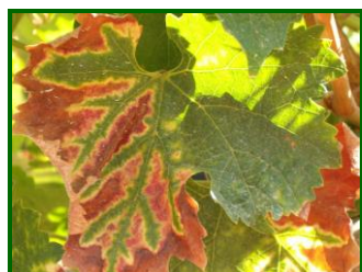
Hoja afectada por Yesca

El concepto de Enfermedades fúngicas de madera en vid , engloba diversas patologías de origen fúngico que comparten como característica común la alteración interna de la madera que parasitan, produciendo fenómenos de necrosis o pudrición. Su progresión suele conllevar la muerte del individuo atacado en un periodo de tiempo indeterminado, que puede variar desde 1-30 años.