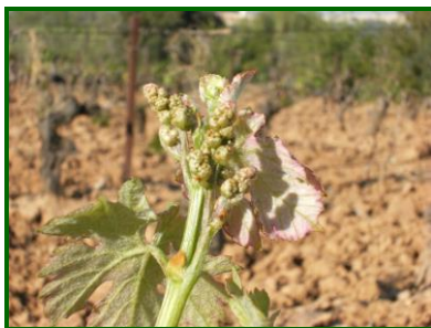
Estado fenológico "F" (Racimos visibles)

En las 4 provincias donde se realiza el seguimiento, el estado fenológico en el mes de marzo estaba comprendido entre "D" (Hojas incipientes) , y "E" (Hojas extendidas) , llegando en las provincias más adelantadas como Huelva, a "H" (Botones florales separados) .