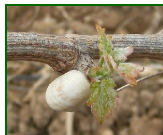
Caracol en brote de vid

No se han realizado aplicaciones fitosanitarias para controlar este agente.