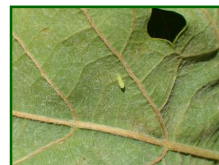
Adulto de Mosquito verde

En Cádiz a mediados de junio, la presencia de mosquito verde ( Empoasca lybica ) fue leve. Siendo en julio cuando se detectó una mayor incidencia en algunas parcelas puntuales, donde se realizaron tratamientos insecticidas para controlarlo. Las elevadas temperaturas, de hasta 42°C en algunos días, hicieron descender sus niveles de presencia. En agosto se incrementó la presencia a lo largo del mes, detectándose una mayor incidencia en algunas parcelas puntuales. En toda la campaña se realizaron entre 1 y 2 tratamientos