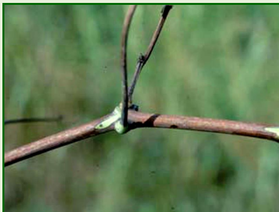
Síntomas de Xylella fastidiosa en vid

Pinche aquí para obtener información detallada y actualizada sobre Xylella fastidiosa .