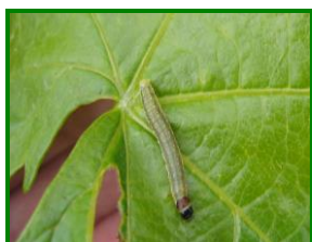
Larva de Piral

Esta plaga solo se ha detectado en algunas parcelas localizadas de la provincia de Córdoba. En esta campaña se ha detectado una menor incidencia de este Lepidóptero, si lo comparamos con la campaña pasada, y en términos generales los ataques han sido bajos y en parcelas muy localizadas.