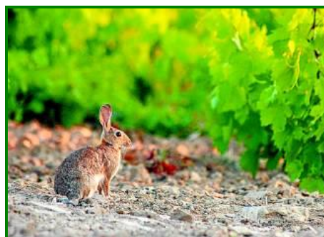
Conejo en viñedo

Debido al comportamiento gregario de estos mamíferos y a sus características fisiológicas, los mayores daños se suelen producir en la brotación del viñedo aunque se prolongan durante todo el ciclo de cultivo. Aunque estos daños son mayores en años en los que la sequía provoca escasez de alimento.