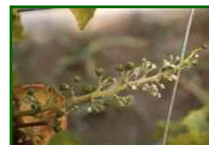
Oidio, daño en racimo

Hay dos periodos donde las viñas son más susceptibles a contraer esta enfermedad: Desde prefloración hasta baya tamaño grano guisante y desde el cerramiento del racimo hasta el envero . La incidencia, a partir de este último punto comienza a decrecer hasta ser tolerantes, debido a la imposibilidad que tiene el hongo de penetrar por la cantidad de azúcar acumulada en las bayas.