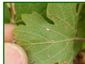
Larva de Melazo

Dicha presencia no ha tenido ningún efecto sobre la cantidad o calidad de la cosecha, no habiéndose realizado ningún tratamiento específico contra este agente. Los habituales tratamientos insecticidas aplicados contra Polilla y Mosquito verde suelen tener controlada a esta cochinilla.