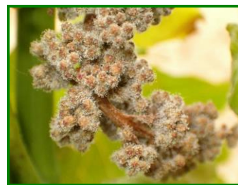
Detalle de esporangios en racimo

Fue Huelva la provincia más afectada, donde iba en aumento la incidencia de mildiu cada semana del mes de mayo, dado que se dieron las condiciones favorables para el inicio y desarrollo de la enfermedad. Se registró a nivel provincial, un 28'8% de cepas afectadas, 4% de hojas con síntomas y 1'8% de racimos con síntomas a finales del mes de abril-principios de mayo. Situación que evolucionó hasta alcanzar valores de 70'2% de cepas afectadas, un 33'3% de hojas con síntomas y un 11'8% de racimos con síntomas a finales de mayo.