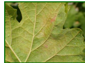
Daños de araña amarilla

En Málaga fue la tercera semana de abril cuando se alcanzó el máximo de la media provincial de cepas con presencia, con el 2'20% y el porcentaje de hojas inferiores con araña el 3% y superiores con araña el 0'8%. Dicha provincia comenzó el mes de junio con una ligera subida de la incidencia, principalmente en parcelas de la zona biológica de la Axarquía, con una media de cepas con presencia de 1'8%, siendo el porcentaje de hojas inferiores del 0'78% y el de hojas superiores con araña del 0'67%. Descendió la siguiente semana, registrándose una media de cepas con presencia del 0'9%, (0'44% hojas inferiores y 0'11% hojas superiores, con araña).