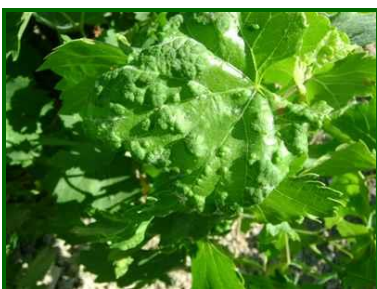
Erinosis (raza de las agallas)

Los daños que causa este agente no son considerados de gran importancia excepto en viveros, plantaciones jóvenes, o en condiciones excepcionales, situación que no se ha producido.