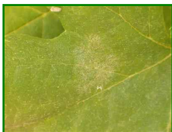
Síntomas en hoja

La humedad ambiental es muy importante e influye en el desarrollo de la enfermedad. Con humedades relativas altas sin lluvias , germinan las conidias.