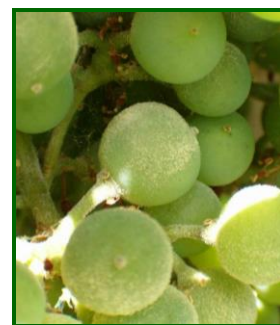
Síntomas de oidio en racimo

Córdoba comenzó el mes de septiembre manteniendo los niveles de ataque, subiendo a mediados de septiembre la media provincial al 5% de cepas afectadas , registradas en el 100% de las parcelas muestreadas (sobre 6), siendo las zonas de La Sierra y Las Arenas con un 6% de media en cada zona y un máximo de 8%, las que registran valores más elevados. También se registraron racimos dañados , con una media provincial de 5%, registrados en el 100% de las parcelas muestreadas (sobre 6), siendo las zonas de La Sierra y Las Arenas con un 6% de media en cada zona y un máximo de 8%, las que registraron valores más elevados. Se realizaron tratamientos siendo la materia activa más utilizada fue Azufre como preventivo, y posteriormente combinando para tratamientos contra mildiu.