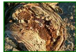
Daños por termitas

Contra este isóptero la estrategia de lucha es únicamente preventiva, manteniendo las cepas en buen estado vegetativo, evitando las heridas y aplicando un cicatrizante en los cortes de poda. Una vez detectadas las cepas dañadas, lo mejor es arrancarlas y destruirlas.