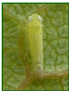
Adulto de mosquito verde

Igualmente en Huelva , fue a finales de junio cuando se comenzó a observar presencia de mosquito verde, principalmente en el último tercio distal del pámpano, y en el 100% de las parcelas muestreadas . A nivel provincial se registró un 32'8% de hojas con presencia , apreciándose escasos daños en forma de decoloraciones marginales de las hojas. En general, el número de insectos por hoja se mantuvo bajo, en torno a 0'33 .