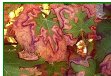
Síntomas de mosquito verde en hoja

Los adultos son de unos 3 mm de largo, y de color verde claro. Se sitúan en el envés de las hojas, y vuelan al mínimo movimiento. Las larvas, muy móviles, se desplazan transversalmente al eje del limbo de la hoja y su color es blanquecino hasta que sufren la primera muda.