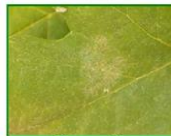
Síntomas en hoja

En este enlace se pueden consultar los productos autorizados, en producción integrada, para este cultivo. Se puede observar que hay varios que son útiles para mildiu y para oidio; habría que valorar, al hacer un tratamiento preventivo contra mildiu, que lo fuera también contra oidio.