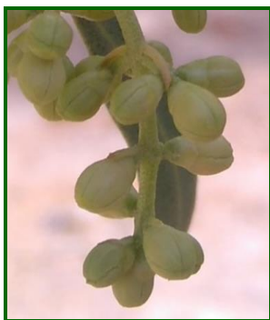
"D3"(Corola cambio color)

En cuanto a la meteorología que se ha registrado durante el mes de abril destaca las escasas lluvias registradas a lo largo de todo el mes. Las temperaturas han sido suaves, experimentando un cierto ascenso a medida que avanzaba el mes, estas condiciones ambientales, han favorecido el desarrollo vegetativo del cultivo.