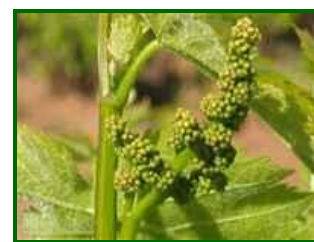
Estado fenológico H

El estado fenológico en el que se encontraban las viñas a lo largo del mes de abril, variaba ligeramente dependiendo de la provincia. Predominaban los estados E/F "Hojas extendidas"/"Racimos visibles" a principio de mes en las provincias más occidentales, cuando en esos momentos las brotaciones eran desiguales dependiendo de la época de poda, las labores, tipo de suelos y edad del viñedo. A finales de mes dominaba "H" (Botones florales separados) , observándose "I" (Floración) en zonas/variedades más adelantadas de Cádiz, Huelva y Málaga; en Córdoba dominaba "G" (Racimos separados) y "H" (Botones florales separados) , provincia donde, en sus zonas más atrasadas aún dominaba "F" (Racimos visibles) .