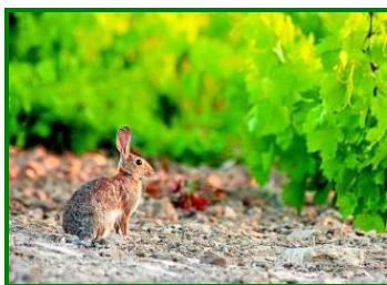
Conejo en viñedo

Se detectan cepas dañadas por estos mamíferos en las provincias de Córdoba y Málaga. En Córdoba se observan daños irregularmente repartidos, especialmente en cepas puntuales de los inicios de los líneas en viñas en espaldera.