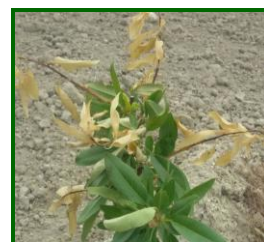
Hojas afectadas por anarsia

En árboles adultos los problemas son leves (despuntes en almendro, que tienen una función de poda en verde), pero en plantaciones jóvenes los problemas pueden ser muy acusados, provocando deformaciones en la estructura del árbol.