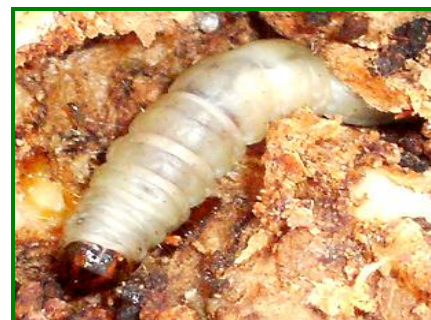
Larva de abichado

Como medida preventiva para evitar los daños de este agente, pasan por causar las mínimas heridas posibles al olivo y evitar las labores de poda y desvareto en los periodos de máximo vuelo de adultos.