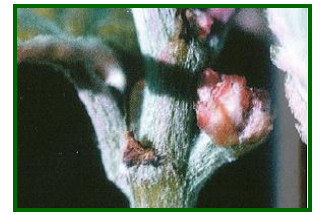
erinosis, raza de las yemas

En Cádiz se observó incidencia muy leve, casi anecdótica, de erinosis ( Colomerus vitis ) en algunas parcelas de la zona biológica de Sanlúcar, y en particular en el municipio de Chipiona, en la variedad "Moscatel"; en el resto de la provincia y variedades su incidencia fue nula.