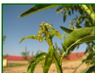
Colonia de pulgones

Se detecta presencia de colonias de pulgones, Hyalopterus amygdali (Pulgón harinoso) de forma generalizada en las parcelas muestreadas en Córdoba, con una media provincial del 13'3 % de brotes ocupados a principio de mes y del 35 % a final del mismo. Se alcanza un máximo de 11% de brotes ocupados, para ir descendiendo hasta un 1'5 % a final de mes y registrado en el 75 % de las parcelas.