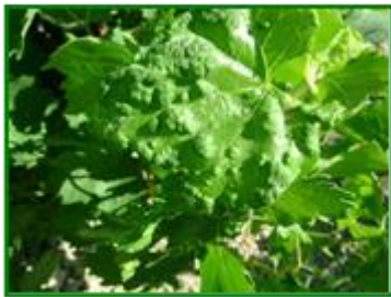
Erinosis (raza de las agallas)

Apareció a mediados de abril en parcelas de control de la Zona Biológica de la Axarquía Malagueña ; en esa zona su incidencia fue del 3% de cepas afectadas, tratándose de la raza de las agallas.