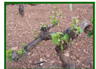
Cepa dañada por conejos.

En Málaga se observaron daños en algunas parcelas de la Zonas Biológica de Antequera Norte. El grado en que se ven afectadas las parcelas depende fundamentalmente de su localización: Las parcelas próximas a montes, vía férrea o taludes