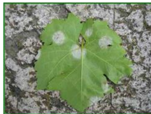
Síntomas de Mildiu

En los racimos, los síntomas en las proximidades de la floración se manifiestan por curvaturas y oscurecimientos del raquis o raspajo y su posterior recubrimiento de una pelusilla blanquecina si el tiempo es húmedo, ocurriendo lo mismo en flores y granos recién cuajados. Cuando los granos superan el tamaño de un guisante no se oscurecen, ni aparece la pelusilla blanquecina, sino que se arrugan y finalmente se desecan, conociéndose como " mildiu larvado ".