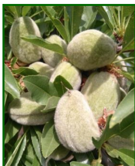
Estado fenológico "J" (Fruto desarrollado)

El estado fenológico dominante ha estado entre "I" (Fruto joven) y "J" (Fruto desarrollado), siendo el más atrasado el de "H" (Fruto cuajado) en las variedades medias y tardías como Guara, Penta, Lausanne, Marinada, Vayro, etc