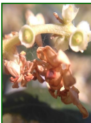
"G1"(Caída de pétalos)

Aprovechando la cuantificación de inflorescencias por brote, se ha realizado una valoración del porcentaje de fertilidad de las flores, destacando por los valores registrados las provincias de Huelva y Cádiz, con un dato medio del 85 y 68% de flores fértiles, respectivamente. Mientras que, en Córdoba y Jaén, registran unos valores medios de 56'20 y 44'80% de flores fértiles a finales del mes de abril.