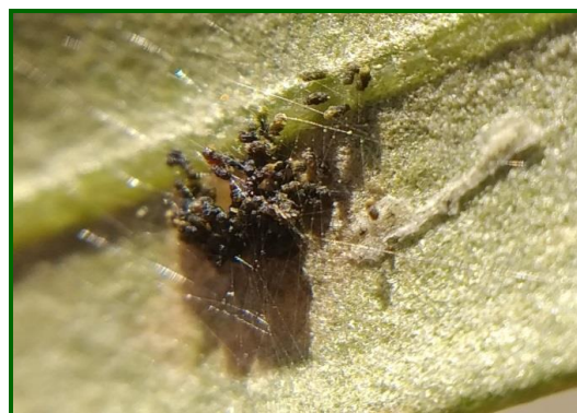
Ataque de larva generación filófaga

Hay que recordar a los agricultores que esta plaga debe ser vigilada principalmente en aquellas plantaciones jóvenes de 2-4 años, que por su escaso porte vegetativo puede provocar daños muy importantes en los brotes y yemas terminales de las ramas lo que afectara al desarrollo del cultivo.