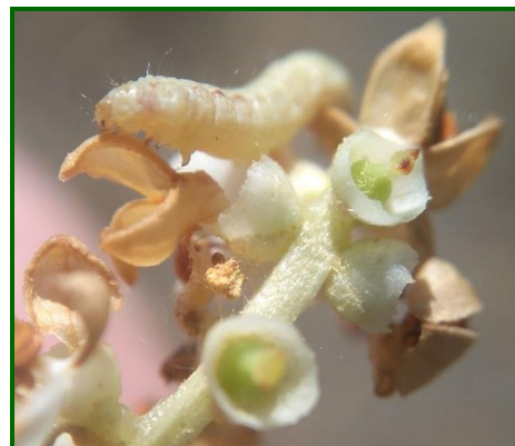
Larva de la generación antófaga.

En cuanto a la incidencia de las larvas de la generación antófaga , sobre las inflorescencias a final de abril, ha sido más destacada en las provincias de Huelva, Sevilla y Córdoba, en donde se registran unos valores medios de 4'40, 4 y 3'40% de inflorescencias atacadas con formas vivas, respectivamente. Con estos datos obtenidos la incidencia sobre inflorescencias son inferiores a los registrados en la pasada campaña.