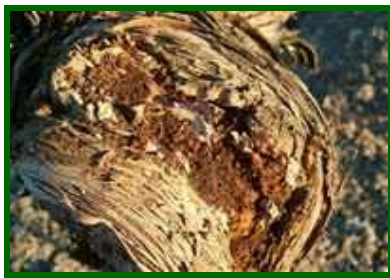
Cepa afectada por termitas

En la zona biológica de la Axarquía Malagueña se detectó presencia de cepas con termitas a principios de abril. Se estimó que en esa zona el 3% de las cepas estaban afectadas.