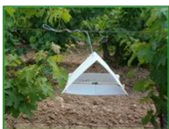
Trampa Delta para Lobesia

A lo largo del mes abril se detectan capturas de polilla del racimo ( Lobesia botrana ) en las parcelas donde se han instalado trampas. El número de adultos por trampa y día alcanzó un valor a mediados de abril en Córdoba con niveles bajos, una media provincial de 0'03 adultos/trampa y día , con un máximo de 0'14. Las ZB de La Sierra y Los Llanos tuvieron medias ligeramente superiores, de 0'04 adultos/trampa y día en ambas y máximos de 0'14. Sin embargo, en algunas parcelas fuera de la API se detectaron niveles de capturas superiores, con especial incidencia en La Sierra de Montilla (zona de Cuesta Blanca), donde dentro de zonas de confusión sexual se capturó 1 adulto y fuera de confusión sexual 82. En otras zonas, así mismo fuera de la API, han sido pocas las capturas, 2 ó 3 en 7 días fuera de confusión sexual.