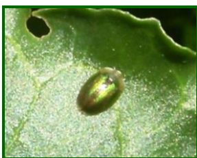
Adulto de Cásida

La presencia de lixus ( Lixus scabricollis ) ha sido muy baja en Cádiz, con una media provincial menor de 0,8 adultos/U.M. (Unidad de Muestra=50 plantas); mientras que en Sevilla ésta ha sido más elevada, alcanzándose, durante todo el mes de abril, unos niveles de la media provincial de entre 6 y 7 adultos/U.M.