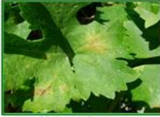
Hoja con síntomas

No se ha detectado presencia de araña amarilla ( Tetranychus urticae ) a lo largo del mes de abril en las provincias andaluzas.