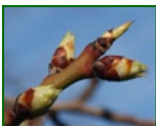
Estado fenológico "B" (Yema hinchada)

El estado fenológico al comienzo de mes dominaba "A" (Yema de invierno dormida) y "B" (Yema hinchada) en las variedades tardías como guara, penta, Lausanne, marinada, vayro, etc. y también se observan el resto de los estados de comienzos de floración como son "C" (Aparece el cáliz), "D" (Aparece la corola)" y "E" (Inicio de floración) en las tempranas como común, Largueta o marcona, sobre todo en las cotas más bajas como es el Valle de Lecrín, Padul/Dúrcal (desmayos).