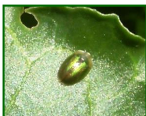
Adulto de Cásida

Respecto a la presencia de cásida ( Cássida vittata ) en el cultivo, en Sevilla, la provincia con mayor daño, el máximo valor de la media provincial ha sido de 66 adultos/U.M. (registrado a principios de junio) y 20 huevos+larvas/U.M. (registrado a finales de junio). En Cádiz, en cambio, su presencia ha sido menor que en Sevilla, registrándose una media provincial máxima de 31 adultos/UM (registrado a primeros de junio) y 12 huevos+larvas/U.M. (registrado durante las tres primeras semanas de junio). En las dos provincias remolacheras se han tenido que realizar, en algún momento, tratamiento insecticida para controlar esta plaga en las parcelas que superaron el respectivo umbral de tratamiento. En las parcelas más tardías se aconseja estar