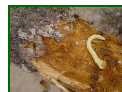
Larva de gusano cabezudo

Tras alimentarse, realizan las puestas durante el verano, cerca de la base del tronco, y las larvas neonatas se dirigirán a las raíces, donde causarán daños al roerlas. En las plantaciones afectadas, el verano es buen momento para intervenir contra los adultos, antes de que invernén. Una buena medida preventiva, en zonas con riesgo de ataque, es cubrir la zona radicular con plásticos para que las larvas no puedan llegar a las raíces. También conviene, si es posible, mantener altos niveles de humedad en la base del tronco para dificultar la llegada de las larvas a las raíces.