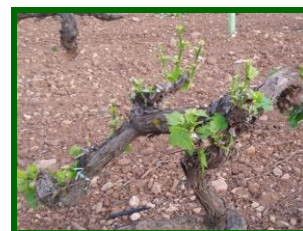
Cepa dañada por conejos.

Se detectan cepas dañadas por estos mamíferos en las provincias de Córdoba y Málaga. En Córdoba se observan daños irregularmente repartidos, especialmente en cepas puntuales de los inicios de los líneas en viñas en espaldera.