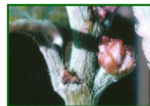
erinosis, raza de las yemas

En Málaga a principios de mes, solamente aparecieron síntomas en parcelas de control de la Zona Biológica de la Axarquía, cuya incidencia fue del 4'0% de cepas afectadas, descendiendo al 2% a finales de mes. Se trataba de la raza de las agallas.