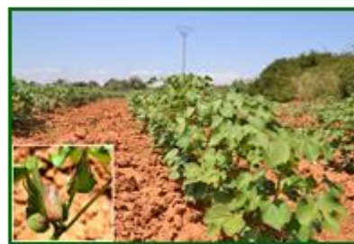
Algodón en botones florales

El estado fenológico dominante en todas las parcelas de la comunidad ha sido el estado "V" (Desarrollo vegetativo) ; observándose, a finales de mes, el estado dominante "B" (Botones) . El estado fenológico más adelantado en algunas de las parcelas más tempranas ha sido, a final de junio, "1C" (Primeras cápsulas pequeñas) . El número medio de botones por hectárea , a finales de junio, ha sido de 692.000 en Córdoba, 536.000 en Sevilla, 374.000 en Jaén y 297.000 en Cádiz.