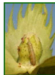
Larva de heliotis en botón floral

A primeros de junio, y en las parcelas más adelantadas de Sevilla y Cádiz, se observaban ya las primeras puestas y larvas de heliotis (Helicoverpa armigera) sobre el cultivo, incrementándose paulatinamente su presencia conforme transcurría el mes. Los niveles de presencia de puestas han oscilado entre los 1.200 huevos/ha de Jaén y los 11.000 de Cádiz. Los niveles de larvas han oscilado entre las 1.600 larvas pequeñas/ha de Jaén y las 6.000 de Cádiz. Se han realizado tratamientos insecticidas contra esta plaga en las parcelas que superaron el umbral de las 8.000