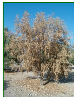
Hoja con síntomas

Como medidas a tomar, para evitar la extensión de este agente se aconseja la eliminación y destrucción de la parte de ramas afectadas por la enfermedad; evitar el exceso de abonado, principalmente el nitrogenado; realizar abonados equilibrados; evitar el exceso de agua en el riego; evitar el movimiento de la capa superficial de suelo, abonar las plantaciones con pasto de Sudán, realizar la solarización de suelos en el punto de plantación del árbol, descontaminar las herramientas de poda; emplear variedades con una cierta resistencia; realizar cubiertas vegetales con plantas de la familia de las crucíferas.