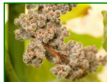
Detalle de esporangios en racimo

En los racimos, los síntomas en las proximidades de la floración se manifiestan por curvaturas y oscurecimientos del raquis o raspajo y su posterior recubrimiento de una pelusilla blanquecina si el tiempo es húmedo, ocurriendo lo mismo en flores y granos recién cuajados. Cuando los granos superan el tamaño de un guisante no se oscurecen, ni aparece la pelusilla blanquecina, sino que se arrugan y finalmente se desecan, conociéndose como " mildiu larvado ".