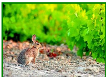
Conejo en viñedo

Se detectan cepas dañadas por estos mamíferos en las provincias de Córdoba y Málaga. En Córdoba se observan daños irregularmente repartidos, especialmente en cepas puntuales de los inicios de los líneas en viñas en espaldera.