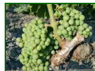
Estado fenológico "L"

El estado fenológico en el que se encontraban las viñas a lo largo del mes de junio, variaba ligeramente dependiendo de la provincia. A principio de mes predominaban los estados "K" (Grano tamaño guisante) y "L" (Cerramiento del racimo) , avanzando a finales de mes hacia "M" (Envero) en parcelas y variedades más adelantadas de zonas de Cádiz y Huelva.