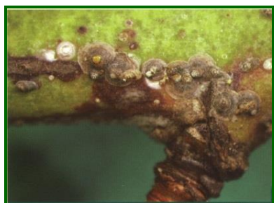
Caparazones de machos y hembras

En Córdoba se registró un nivel bajo, con un porcentaje de brotes atacados del 0'2 % y un máximo del 10 %. En Málaga del 1%.