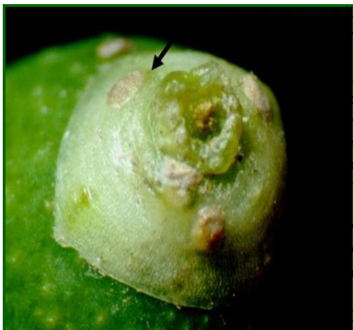
Puestas de prays generación carpófaga

Aproximadamente a mediados de junio y dependiendo de provincias cuando se produce el máximo de las puestas que darán lugar a las larvas de la generación carpófaga , generalizándose paulatinamente este hecho en todas las provincias.