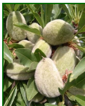
Estado fenológico "J" (Fruto desarrollado)

El estado fenológico dominante ha sido "J" (Fruto desarrollado), con llenado de grano y endurecimiento de cáscara y el más atrasado a comienzos de mes "I" (Fruto joven).