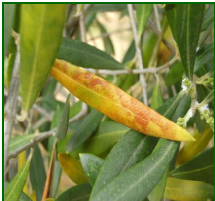
Hoja con síntomas

En las mismas fechas que se realizaron las observaciones para determinar la presencia de repilo visible, se realizaron las prospecciones para valorar la presencia de hojas con repilo plumizo ( Pseudocercospora cladosporioides ), en el cultivo, esta enfermedad afecta a las hojas, produciendo manchas cloróticas amarillas, que después se necrosan, las defoliaciones pueden llegar a ser importantes. También puede afectar a los frutos verdes causándoles lesiones. El desarrollo de esta enfermedad se ve favorecido por tiempo húmedo y se produce en la misma época que el repilo.