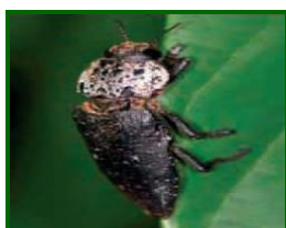
Adulto de gusano cabezudo

Hay que arrancar los árboles afectados, quemar las raíces y tronco, si la normativa medioambiental lo permite, en todo caso hay que destruirlos.