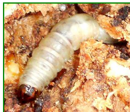
Larva de abichado

Como medida preventiva para evitar los daños de este agente, pasan por causar las mínimas heridas posibles al olivo y evitar las labores de poda y desvareto en los