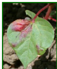
Hoja atacada por Araña

Los índices de presencia de pulgones (Aphis gossypii) en el cultivo han sido leves en general, inferiores al nivel 1 (nivel de 0 a 3); siendo Jaén la provincia más afectada, con un nivel máximo de 0,7. El resto de provincias algodonereras han alcanzado máximos inferiores a 0,6. Éstos se han localizado principalmente en las lindes y en focos aislados en el interior de las parcelas, requiriendo control químico en algunas parcelas de todas las provincias.