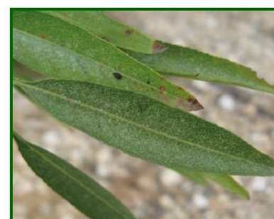
Síntomas en hojas de P. ulmi

La fauna auxiliar es muy importante para mantener controladas las poblaciones. Se puede citar a los ácaros fitoseidos y el coleóptero Stethorus punctillum como