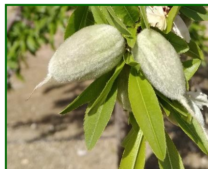
Estado fenológico "I" (Fruto joven)

El estado fenológico dominante ha sido "J" (Fruto desarrollado), con llenado de grano y endurecimiento de cáscara y el más atrasado a comienzos de mes "I" (Fruto joven).