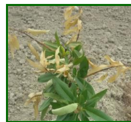
Hojas afectadas por anarsia

En árboles adultos los problemas son leves (despunte en almendro, que tienen una función de poda en verde), pero en plantaciones jóvenes los problemas pueden ser muy acusados, provocando deformaciones en la estructura del árbol.