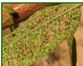
Hoja afectada por tigre del almendro

Continúan los síntomas en Córdoba, con un porcentaje de brotes atacados con formas vivas del 0'30%, registrados en el 30 % de las parcelas muestreadas y un máximo del 1% a comienzos de mes, para aumentar hasta el 1 % a finales del mismo, máximos del 10 % y observados en el 10 % de las parcelas. En Málaga la media de brotes atacados con formas vivas de este insecto fue del 10 %. En Granada y Almería el porcentaje fue muy bajo, tan sólo del 0'1 %.