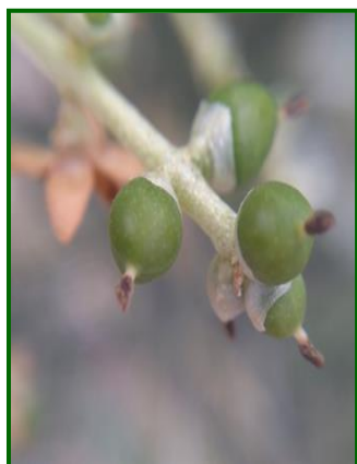
"Gz" (Fruto cuajado)

En cuanto a las condiciones ambientales durante el mes de junio, la nota más destacable son las escasas precipitaciones registradas durante todo este mes, registrándose dos momentos, uno a primeros de mes y el otro a mediados. Las temperaturas han experimentado un ascenso a medida que avanzaba el mes, estas condiciones meteorológicas, están produciendo una reducción de la humedad del suelo.