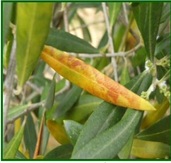
Hoja con síntomas

De los muestreos realizados para determinar la presencia de este agente en las diferentes provincias, la incidencia que ha registrado este agente sobre el cultivo ha sido más significativa la obtenida en Huelva y Cádiz, con un 3'60 y 2'20% de hojas con síntomas.