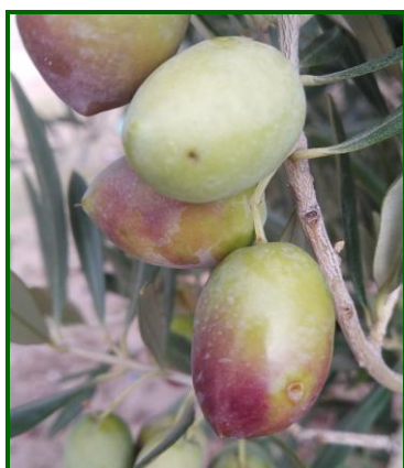
Frutos afectados por Mosca del Olivo

La lluvia registrada durante el mes de octubre ha mejorado la evolución vegetativa en el cultivo, no logrando que desaparezca el estado de agostamiento que venían padeciendo los frutos desde los meses estivales.