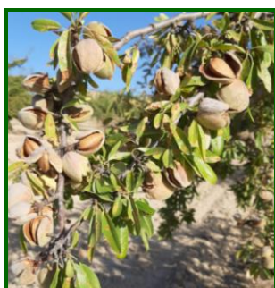
Estado fenológico "L" (Madurez, desecación del mesocarpio)

El estado fenológico dominante ha sido "L" (Madurez, desecación del mesocarpio) y el más atrasado "K" (Fruto dehiscente, separación del mesocarpio). Plena recolección en las zonas más atrasadas. Comienzan a caerse las hojas, sobre todo por el efecto de la sequía y altas temperaturas de los meses anteriores.