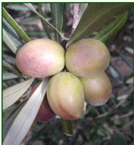
"I2" (Envero – manchas rojas)

La climatología en octubre se ha caracterizado por suaves temperaturas y unas escasas lluvias acumuladas durante todo el mes. El paso de un frente nuboso a primeros de mes produjo precipitaciones de escasa cuantía y generalizadas en todas las provincias provocando un ligero descenso de las temperaturas. A finales del mes, se produjo el paso de varios frentes nubosos que dejaron lluvias, acompañado por un notable descenso de las temperaturas, siendo más cuantiosas en las provincias más occidentales como Sevilla, Jaén y Córdoba, con valores acumulados durante el mes de 26'95, 26'06 y 24'95 l/mt 2 , respectivamente, mientras que, Málaga, Granada y Huelva, han sido las provincias que acumularon los valores más bajos en este periodo con 12'11, 13'71 y 18'20 l/mt 2 , respectivamente.