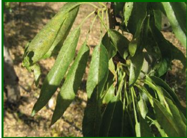
Síntomas en hojas de E. carpini

En las provincias de Granada y Almería, el porcentaje de brotes atacados con formas vivas ha sido del 0'5 % , máximos del 1 % y registrado en la mitad de las ECBs muestreadas.