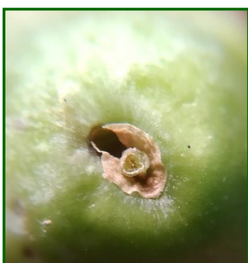
Orificio de salida larva de polilla olivo

Por Zonas Biológicas, destaca Villamartín (Cádiz) y Mágina Norte (Jaén) con unas capturas de 3'90 y 2'40 adultos/trampa y día, respectivamente.