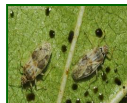
Adulto de tigre del almendro

Las hojas afectadas por la actividad de este agente presentan un punteado sobre el haz de la hoja y en el envés se observa una serie de pequeños puntos negros que son sus excrementos, la hoja se debilita, reduciendo la actividad fotosintética, y cuando el ataque es muy agresivo se produce la caída de las hojas.