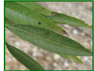
Síntomas en hojas de P. ulmi

La fauna auxiliar es muy importante para mantener controladas las poblaciones. Se puede citar a los ácaros fitoseidos y el coleóptero Stethorus punctillum como depredadores naturales de esta plaga. El respeto a esta fauna auxiliar, realizando solamente los tratamientos estrictamente necesarios, es fundamental para evitar problemas con los ácaros.