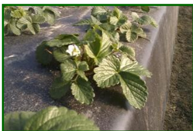
Primeros botones florales

El estado fenológico dominante es B/C "Aparición de los primeros botones florales"/ C "Floración y fructificación" . En lo que va de campaña se observa, en general, cierto retraso en la transición de los estados fenológicos A/B/C . Ello se debe, entre otros, a factores meteorológicos.