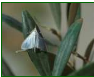
Adulto de glifodes

El porcentaje de brotes de la copa afectados está siendo nulo por el momento en las estaciones de control muestreadas.