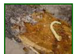
Larva de gusano cabezudo

Cuando nazcan las larvas se dirigirán hacia a las raíces donde se alimentan hasta completar su desarrollo. En ese momento se dirigen a la zona del cuello del árbol, donde pasarán al estado de ninfa. De ésta saldrán los nuevos adultos, desde finales de junio hasta agosto, los cuales pasarán el invierno refugiados y sobrevivirán hasta el siguiente verano.