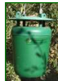
Trampa Funnel para capturar adultos

Los daños más graves de esta plaga se producen en olivar joven, las mariposas aprovechan para poner los huevos en pequeñas heridas, cortes de poda, roce de los arados, verrugas de tuberculosis, grietas, etc. Como medida preventiva hay que provocar las mínimas heridas posibles al olivo y evitar las labores de poda y desvareado en los periodos de máximo vuelo de adultos.