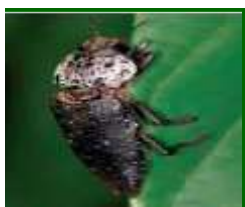
Adulto de gusano cabezudo

Continúa observándose presencia de adultos , antes de que bajen al suelo, ya que las hembras, en breve realizarán la puesta en el suelo alrededor del tronco.