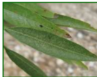
Síntomas en hojas de P. ulmi

Hay medidas culturales que ayudan a mantener bajos los niveles de ácaros, la principal es el uso racional del abono nitrogenado para que no sea excesivo el crecimiento vegetativo del árbol.