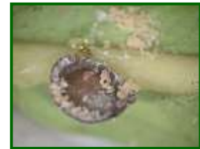
Hembra de cochina de la tizne con huevos eclosionados

El muestreo realizado durante estas fechas destinado a evaluar el número de adultos vivos no parasitados por brote , ha arrojado un registro nulo esta campaña.