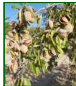
Estado fenológico "k" (Fruto dehiscente)

Para cualquier cuestión relacionada con la sanidad vegetal de su explotación agraria consulte con su asesor fitosanitario .