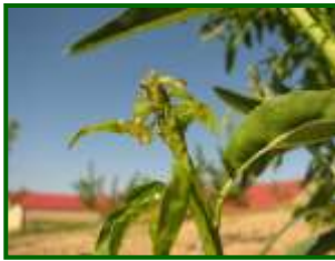
Colonia de pulgones

Gracias a las elevadas temperaturas, desciende el porcentaje de brotes ocupados de pulgón verde, con un valor del 1 % , y registrado en la mitad de las parcelas muestreadas, sobre todo de Hyalopterus amygdali (Pulgón harinoso). También se pueden observar focos de Pterochloroides persicae (Pulgón de la madera).