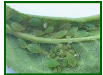
Colonia de pulgones

Gracias a las elevadas temperaturas, desciende el porcentaje de brotes ocupados de pulgón verde, con un valor del 1 % , y registrado en la mitad de las parcelas muestreadas, sobre todo de Hyalopterus amygdali (Pulgón harinoso). También se pueden observar focos de Pterochloroides persicae (Pulgón de la madera).