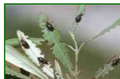
Daño en hojas

Si los daños son de gravedad se pueden destruir los nidos por medio de labores culturales, efectuando una cava alrededor de los troncos.