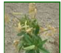
Hojas afectadas por anarsia

En árboles adultos los problemas son leves (despunte en almendro, que tienen una función de poda en verde), pero en plantaciones jóvenes los problemas pueden ser muy acusados, provocando deformaciones en la estructura del árbol.