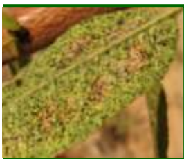
Hoja afectada por tigre del almendro

Presencia de brotes atacados con formas vivas, con un porcentaje del 5 % , registrados en el 30 % de las parcelas muestreadas.