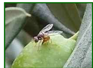
Mosca del olivo

No se observan frutos picados por el momento en las zonas biológicas muestreadas y es de esperar que las elevadas temperaturas y baja humedad ambiental limiten mucho la viabilidad de las distintas fases biológicas de este insecto. Por esto, en estas fechas, conviene empezar la vigilancia en las zonas litorales, en olivares de montaña, etc. es decir, donde se produzcan condiciones ambientales con temperaturas entre 20°C y 25°C (valores óptimos).