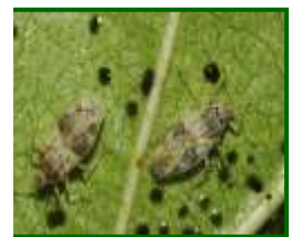
Adulto de tigre del almendro

Es interesante realizar un reconocimiento de las parcelas para valorar el grado de presencia de este agente y % de eclosión de huevos . En caso de duda solicite información a su asesor o servicio técnico de su asociación .