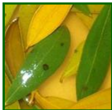
Método de la "sosa"

Es muy importante dotar a los olivos de una formación que favorezca la aireación de la copa, evitando, de esta manera, la condensación y/o acumulación de agua en la superficie de la hoja, ya que, de este factor, junto a las temperaturas que se registran en nuestras zonas, va a depender la germinación de esta enfermedad, prestando especial atención al periodo que pronto se iniciará, otoño-invierno , en el que varios días de lluvia podrían favorecer la infección y desarrollo de este patógeno. Se recomienda, por ello, que, si se va a proteger la masa foliar, las aplicaciones fungicidas se realicen en el momento apropiado, este es, finales de verano o principios del otoño , dependiendo siempre de la previsión meteorológica.