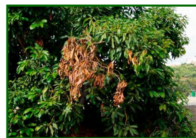
Síntomas en ramas

Las esporas de los hongos penetran por heridas de las ramas, cuidado en los momentos de poda.