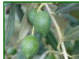
Estado fenológico "H"

En las parcelas de control el estado fenológico dominante es "H" (endurecimiento del hueso).