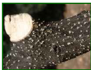
Orificios de entrada

Este insecto busca la madera de la poda para reproducirse y efectuar las puestas. Una vez evolucionadas las larvas, los nuevos adultos hacen unos orificios para salir y buscarán los brotes de los olivos para alimentarse.