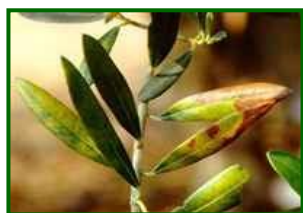
Hojas con síntomas

Los datos obtenidos en marzo indican que la media provincial de hojas afectadas es menor del 0'1%, el año pasado en esas fechas se obtuvo el 0,1%; se han encontrado síntomas en el 15% de las 39 parcelas de control muestreadas.