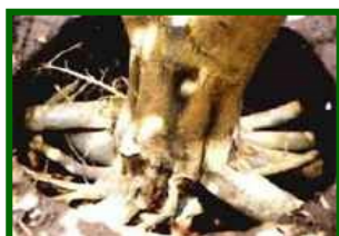
Cuello y raíces afectadas

Se ha evaluado la cantidad de árboles que presentan síntomas de la enfermedad, en las parcelas de control se estima un 4'0% de árboles afectados.