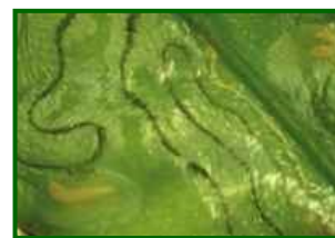
Larva de minador en hoja

Las plantaciones jóvenes, en crecimiento, necesitan desarrollar todos sus brotes y el minador las puede perjudicar seriamente; las plantaciones adultas, en cambio, no se suelen ver afectadas de forma negativa por este insecto.