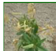
Hojas afectadas por anarsia

En árboles adultos los problemas son leves (despunte en almendro, que tienen una función de poda en verde), pero en plantaciones jóvenes los problemas pueden ser muy acusados, provocando deformaciones en la estructura del árbol.