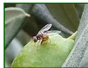
Mosca del olivo

Señalar que entre la fauna auxiliar que puede ejercer un cierto control sobre el crecimiento poblacional de este agente están Pnigalio mediterraneus , Psittalia concolor , Eurytoma martellii , Cyrtomyia latipes y Eupelmus urozonus .