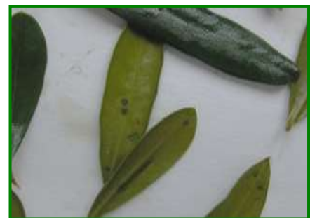
Hojas con Repilo incubado

Se recomienda extremar la vigilancia sobre el desarrollo de esta importante enfermedad, ya que las lluvias pueden favorecer la diseminación de esporas, y ayudar a nuevas reinvasiones del hongo. Cabe recordar que para la germinación del hongo se necesita agua libre sobre la conidia (elemento reproductor del hongo) y sobre la zona de penetración en el tejido receptor (normalmente la hoja), así como temperaturas comprendidas entre 8 y 24° C, con una temperatura óptima de 20 ° C.