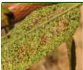
Hoja afectada por tigre del almendro

Presencia de brotos atacados con formas vivas, con un porcentaje del 10 % , registrados en la totalidad de las parcelas muestreadas.