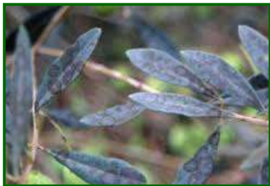
Hoja con síntomas de Repilo

Por el momento no se han observado hojas con repilo visible en ninguna de las zonas biológicas muestreadas. Sería conveniente estar atento a su evolución después de que se registren lluvias.