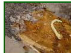
Larva de gusano cabezudo

Cuando nazcan las larvas se dirigirán hacia a las raíces donde se alimentan hasta completar su desarrollo. En ese momento se dirigen a la zona del cuello del árbol, donde pasarán al estado de ninfa. De ésta saldrán los nuevos adultos, desde finales de junio hasta agosto, los cuales pasarán el invierno refugiados y sobrevivirán hasta el siguiente verano.