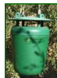
Trampa Funnel para capturar adultos

Los daños más graves de esta plaga se producen en olivar joven, las mariposas aprovechan para poner los huevos en pequeñas heridas, cortes de poda, roce de los arados, verrugas de tuberculosis, grietas, etc. Como medida preventiva hay que provocar las mínimas heridas posibles al olivo y evitar las labores de poda y desvareto en los periodos de máximo vuelo de adultos.