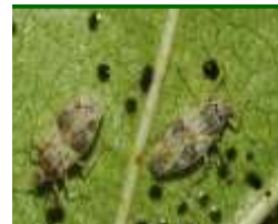
Adulto de tigre del almendro

Es interesante realizar un reconocimiento de las parcelas para valorar el grado de presencia de este agente y % de eclosión de huevos . En caso de duda solicite información a su asesor o servicio técnico de su asociación .