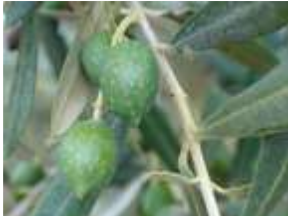
Estado fenológico "H"

El estado fenológico dominante es "H" (Endurecimiento de hueso). Se observan síntomas de sequía en los frutos de los secanos rigurosos.