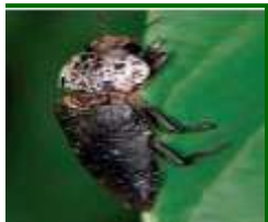
Adulto de gusano cabezudo

Continúa observándose presencia de adultos, antes de que bajen al suelo, ya que las hembras, en breve realizarán la puesta en el suelo alrededor del tronco.