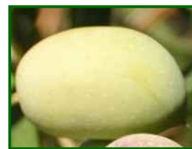
Estado fenológico "11"

En las parcelas de control el estado fenológico dominante es "H" (endurecimiento del hueso) en el 86% de ellas, en el 14% restante es "11" (envero, amarillo).