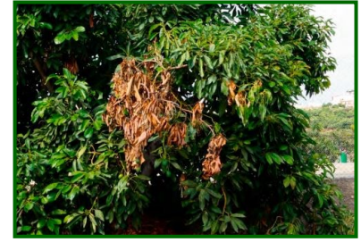
Síntomas en ramas

Siempre que se detecte una rama afectada hay que cortarla y destruirla sin incorporarla al suelo porque las estructuras de resistencia de los hongos permanecerán allí.