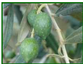
Estado fenológico "H"

Según la previsión meteorológica de la próxima semana la temperatura será similar a la de ésta y es muy poco probable que ocurran precipitaciones.