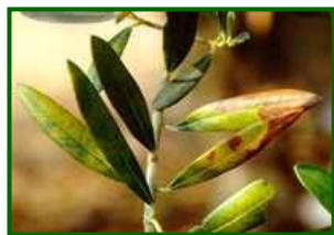
Hojas con síntomas

Los datos obtenidos en marzo indican que la media provincial de hojas afectadas es menor del 0,1%, el año pasado en esas fechas se obtuvo el 0,1%; se han encontrado síntomas en el 15% de las 39 parcelas de control muestreadas.