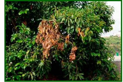
Síntomas en ramas

Las esporas de los hongos penetran por heridas de las ramas, cuidado en los momentos de poda.