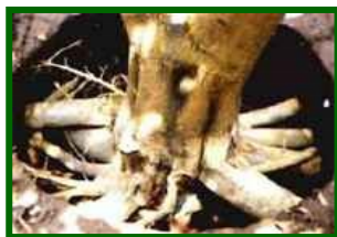
Cuello y raíces afectadas

Se ha evaluado la cantidad de árboles que presentan síntomas de la enfermedad, en las parcelas de control se estima un 4'0% de árboles afectados.