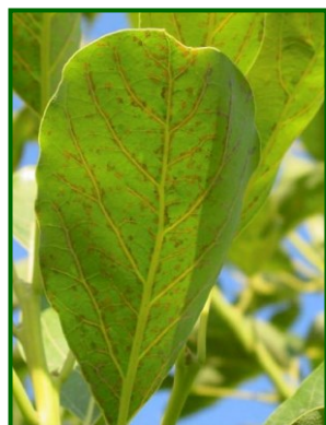
Ácaro cristalino, síntomas

Aumenta de nuevo la incidencia del ácaro. La media provincial de hojas con formas móviles es el 25,1%, en la Axarquía el 30,4%, y en el Guadalhorce el 7,9%.