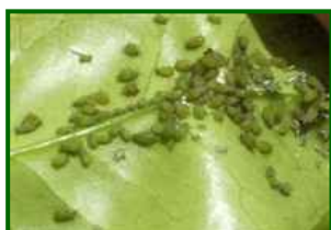
Colonia de pulgones en hoja

En las parcelas de control, el porcentaje medio de brotes con presencia es prácticamente nulo.