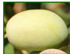
Estado fenológico "11"

En el 76% de las parcelas de control el estado fenológico dominante es "11" (envero, amarillo) y en el 24% restante es "H" (endurecimiento del hueso).