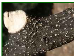
Orificios de entrada

Este insecto busca la madera de la poda para reproducirse y efectuar las puestas. Una vez evolucionadas las larvas, los nuevos adultos hacen unos orificios para salir y buscarán los brotes de los olivos para alimentarse.