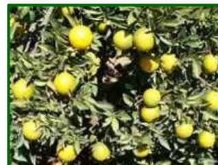
Estado fenológico "K"

El estado fenológico dominante en las parcelas de control se encuentra entre J (fruto al 40% desarrollado) y K (envero).