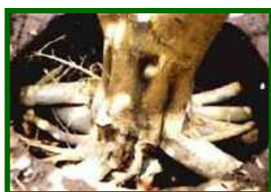
Cuello y raíces afectadas

Se ha evaluado la cantidad de árboles que presentan síntomas de la enfermedad, en las parcelas de control se estima un 4'0% de árboles afectados.