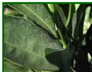
Síntomas en hoja

Se detecta presencia de estos ácaros en algunas parcelas de control, la incidencia sube hasta el 6,0% de hojas con formas móviles.