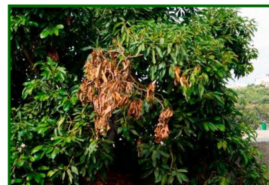
Síntomas en ramas

Las esporas de los hongos penetran por heridas de las ramas, cuidado en los momentos de poda.