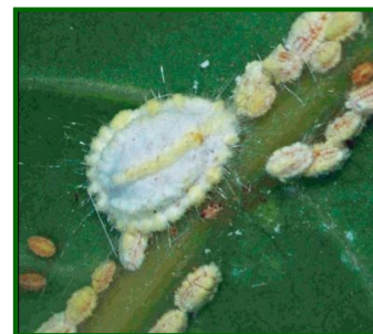
Hembra adulta y ninfas

Se trata de una especie partenogenética (reproducción por doncellas) esto quiere decir que hay momentos en que las hembras solas pueden producir una nueva generación (haploide) que puede ser muy numerosa con el objeto de colonizar rápidamente y con gran número de individuos.