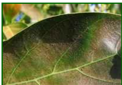
Hoja con araña parda

En la actualidad no se aprecian síntomas de este ácaro en ninguna parcela de control.