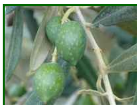
Estado fenológico "H"

Según la previsión meteorológica de la próxima semana la temperatura bajará y ocurrirán precipitaciones.