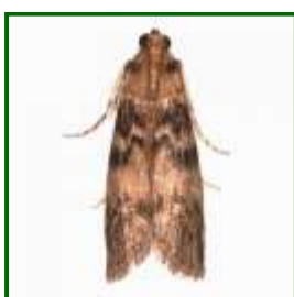
Adulto de Euzofera

Por el momento no se observa presencia de larvas en ramas en ninguna de las estaciones de control.