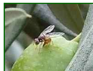
Mosca del olivo

Según el Reglamento de Producción Integrada del olivar, los criterios de intervención se llevarán a cabo cuando el umbral del primer tratamiento para aceituna de almazara alcance más de 1 captura de adulto en mosquero y día, el 60 % de las hembras estén fértiles y se registre la aparición de la primera picada.