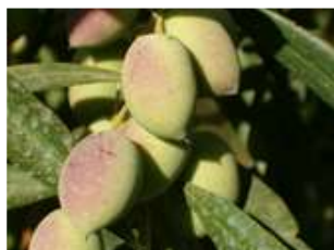
Estado fenológico "12" (Envero-manchas rojas)

El estado fenológico dominante es "11" (Envero amarillo) y como más avanzado "12" (Envero manchas rojas). Se observan síntomas de sequía en los frutos de los secanos rigurosos.