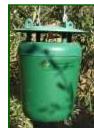
Trampa Funnel para capturar adultos

Los daños más graves de esta plaga se producen en olivar joven, las mariposas aprovechan para poner los huevos en pequeñas heridas, cortes de poda, roce de los arados, verrugas de tuberculosis, grietas, etc. Como medida preventiva hay que provocar las mínimas heridas posibles al olivo y evitar las labores de poda y desvareto en los periodos de máximo vuelo de adultos.