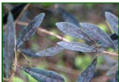
Hoja con síntomas de Repilo

Por el momento no se han observado hojas con repilo visible en ninguna de las zonas biológicas muestreadas. Sería conveniente estar atento a su evolución después de que se registren lluvias.