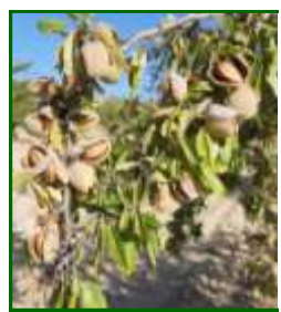
Estado fenológico "k" (Fruto dehiscente)

Para cualquier cuestión relacionada con la sanidad vegetal de su explotación agraria consulte con su asesor fitosanitario .