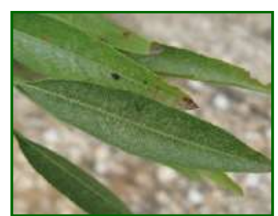
Síntomas en hojas de P. ulmi

ulmi puede presentar también un periodo de actividad en la primavera, tras la eclosión de los huevos. Momento en que es más vulnerable, a la hora de valorar intervención.