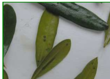
Hojas con Repilo incubado

Se recomienda extremar la vigilancia sobre el desarrollo de esta importante enfermedad, ya que las lluvias pueden favorecer la diseminación de esporas, y ayudar a nuevas reinvasiones del hongo. Cabe recordar que para la germinación del hongo se necesita agua libre sobre la conidia (elemento reproductor del hongo) y sobre la zona de penetración en el tejido receptor (normalmente la hoja), así como temperaturas comprendidas entre 8 y 24° C, con una temperatura óptima de 20 ° C.