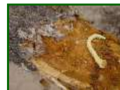
Larva de gusano cabezudo

Cuando nazcan las larvas se dirigirán hacia a las raíces donde se alimentan hasta completar su desarrollo. En ese momento se dirigen a la zona del cuello del árbol, donde pasarán al estado de ninfa. De ésta saldrán los nuevos adultos, desde finales de junio hasta agosto, los cuales pasarán el invierno refugiados y sobrevivirán hasta el siguiente verano.