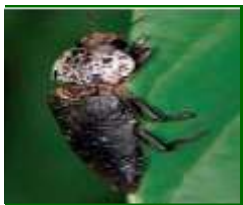
Adulto de gusano cabezudo

Continúa observándose presencia de adultos , antes de que bajen al suelo, ya que las hembras, en breve realizarán la puesta en el suelo alrededor del tronco.