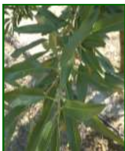
Síntomas en hojas

El porcentaje de brotes ha descendido, con un valor del 15 % , y registrado en todas las ECBs muestreadas. Se observa mayor presencia sobre todo en las plantaciones que no se protegieron con tratamientos preventivos y en variedades más sensibles como Guara, Antoñeta, etc, mientras que Lauranne, Vairo o ferragnes presentan una mayor tolerancia.