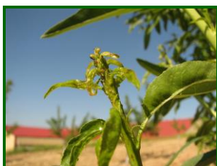
Colonia de pulgones

Se observan colonias de pulgones Hyalopterus amygdali (Pulgón harinoso) con un 2 % de brotes afectados .