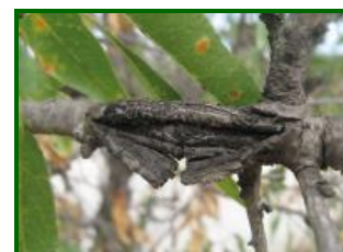
Daño en madera

Es importante que las parcelas se encuentren protegidas contra el hongo, ya que es durante la floración cuando la enfermedad provoca la mayor parte de los daños en el almendro.