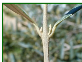
Estado fenológico "B"

Para la semana del 31 de marzo al 6 de abril de 2025, la Agencia Estatal de Meteorología (AEMET) prevé en la provincia de Córdoba un inicio con cielos cubiertos y posibilidad de tormentas y lluvias escasas el lunes, con temperaturas entre 9°C y 16°C. A partir del martes, se espera una mejora progresiva, con cielos poco nubosos o despejados y temperaturas en ascenso, alcanzando máximas de hasta 30°C el sábado y mínimas alrededor de 14°C. Los vientos serán generalmente suaves, variando en dirección: el lunes predominarán del oeste y suroeste, y en los días siguientes del noreste y este.