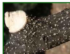
Orificios de entrada

El momento en que se ocasionan los daños es justo tras la salida de una nueva generación de la leña de la poda, pero no estamos en esa circunstancia; ahora los adultos se dirigen a los restos de poda para efectuar galerías donde reproducirse y se están detectando entradas en los palos cebo colocados.