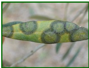
Hoja con síntomas

El repilo del olivo ( Fusicladium oleagineum , antes Spilocaea oleagina ) es una enfermedad fúngica que afecta principalmente a las hojas del olivo, aunque en casos severos también puede dañar brotes y peciolas. El hongo penetra a través de los estomas y desarrolla su micelio en el interior de la hoja, donde forma manchas circulares de color oscuro que posteriormente se necrosan, provocando defoliación prematura. Esta pérdida de hoja reduce la capacidad fotosintética del árbol, debilitándolo y disminuyendo la producción de aceituna en las siguientes campañas.