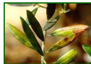
Hojas con síntomas