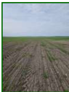
Daños en cereal

El muestreo se realizó en la segunda quincena del mes de enero, coincidiendo con el primer informe de campaña. La incidencia de gusano de alambre se observó en la mayoría de las parcelas de seguimiento. La media provincial ha sido de un 1,11 % de plantas muertas . Se detectó presencia de este agente en el 87 % de las parcelas muestreadas. La zona biológica que alcanzó una media más elevada fue Campiña Baja Central, con 1,42 % de plantas muertas.