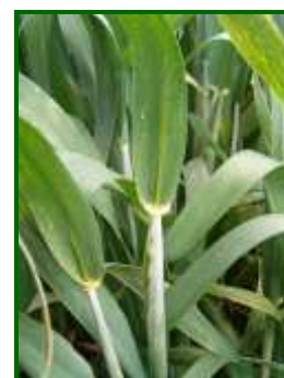
Comienzo del espigado

Según indica la previsión meteorológica , las temperaturas de la semana próxima irán subiendo hasta alcanzar, en algunas zonas, los 23 °C de máxima y los 9 °C de mínima. No se esperan nuevas precipitaciones.