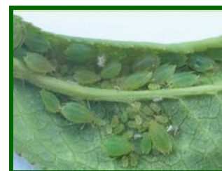
Colonia de pulgones

Es conveniente estar atentos a su evolución con el aumento de la temperatura, ya que pueden llegar a provocar en casos de elevada presión de población, debilitamiento, amarilleamientos y retraso del crecimiento. Su presencia se detecta por los característicos síntomas de hojas con brillos en la superficie, producido por el efecto de la melaza segregada por los adultos. Conviene a su vez vigilar la