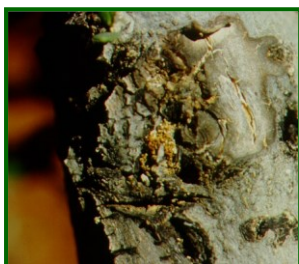
Excrementos de larvas

Las larvas de este lepidóptero pueden producir la muerte de ramas debido a las galerías alimenticias que efectúan en ellas y puede ser grave en plantaciones jóvenes.